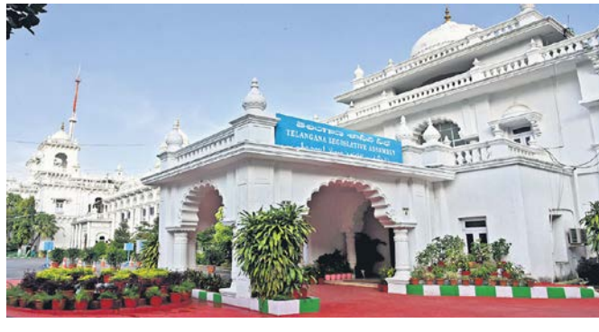
హైదరాబాద్, ఆగస్టు 2, (స్టూన్ వర్న్)