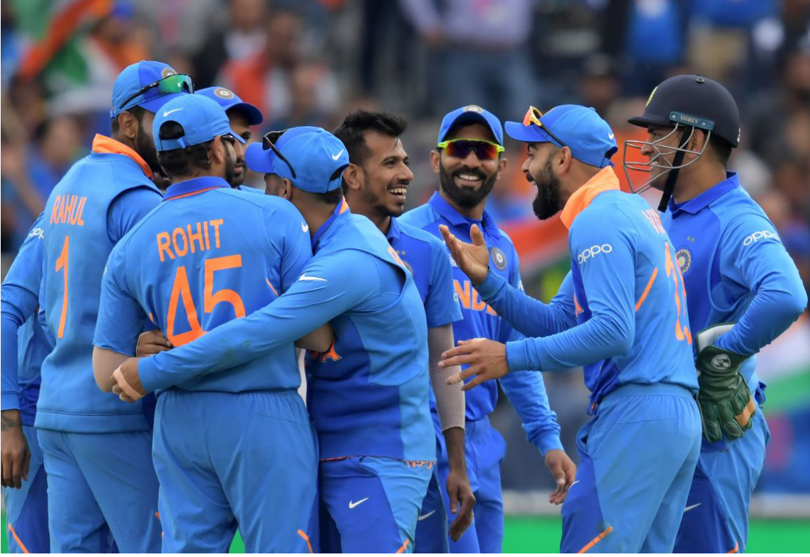
అహ్మదాబాద్ లో తలపడనున్న భారత్, పాకే జట్టు అయితే.. దాయాది పాకిస్తాన్ జట్టు భారత్ కు రావడంపై ఇంకా సందిగ్ధత నెలకొంది. పాకే

అంతర్జాతీయ క్రికెట్ కౌన్సిల్ వరల్డ్ కప్ అవేదీ టెడ్ షెడ్యూల్ ను విడుదల చేసింది. శ్రీలంక, నెదర్లాండ్స్ జట్లు వరల్డ్ కప్ టోర్నీకి అర్హత సాధించడంతో సవరణలతో కూడిన షెడ్యూల్ ను ఈరోజు ప్రకటించింది. అక్టోబర్ 7న శ్రీలంక జట్టు తొలి మ్యాచ్ లో దక్షిణాఫ్రికాను డీ కొట్టనుంది. నవంబర్ 9న లంక ఆఖరి లీగ్ మ్యాచ్ లో న్యూజిలాండ్ తలపడనుంది. మరోవైపు నెదర్లాండ్స్ జట్టు అక్టోబర్ 6న తమ తొలి పోరులో పాకిస్తాన్ ను ఎదుర్కొనుంది. జింబాబ్వే వేదికగా జరిగిన వరల్డ్ కప్ క్వాలిఫయర్స్ పోటీల్లో అదరగట్టిన శ్రీలంక, నెదర్లాండ్స్ ఆఖరి రెండు టెస్టులను దక్కించుకున్న విషయం తెలిసిందే. ఫైనల్ లంక 128 పరుగుల తేడాతో నెదర్లాండ్స్ ను చిత్తు చేసి వరల్డ్ కప్ క్వాలిఫయర్ చాంపియన్ గా నిలిచింది. రెండుసార్లు చాంపియన్ వెస్టిండీస్ అనుభాంగా టోర్నీ నుంచి నిష్క్రమించి క్రికెట్ ప్రపంచాన్ని పాకేకు గురి చేసింది. ఈ ఏడాది వచ్చే వరల్డ్ కప్ అక్టోబర్ 5న భారత గడ్డపై మొదలవుతుంది. ఆరంభ పోరులో 2019 ఫైనలిస్టులు న్యూజిలాండ్, ఇంగ్లండ్ తలపడనున్నారు. భారత్, పాకిస్తాన్ మ్యాచ్ అహ్మదాబాద్ లోని సరేంద్ర మోది స్టేడియం వేదికగా అక్టోబర్ 15న జరగనుంది. నవంబర్ 19న ఫైనల్ ఫైట్ ఉంది. ఈ ఏడాది వరల్డ్ కప్ ప్రత్యేకత ఏంటంటే..? ఫైనల్ తో పాటు సెమీ ఫైనల్ మ్యాచ్ లకు ఐసీసీ రిజర్వ్ డే ను కేటాయించింది. ఈ టోర్నీలో మొత్తం 10 జట్లు పాల్గొంటున్నాయి.