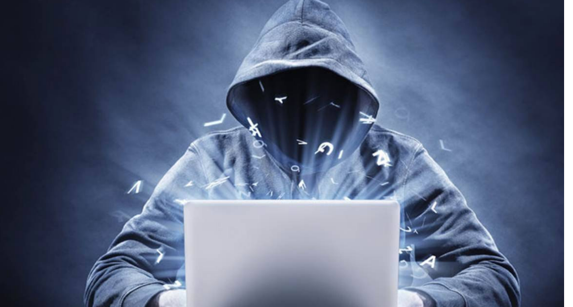
జయభేరి, ముంబై :

సైబర్ నేరాలపై పోలీసులు, ప్రభుత్వం ప్రజల్లో అవగాహన పెంచుతూ ఆన్లైన్ వేదికగా సైబర్ నేరాలపై సాధారణ ప్రజలకు అవగాహన కలిగించే ప్రయత్నం చేస్తున్నారు. రోజుకో స్కామ్ తో అమాలుకుల నుంచి కేటాగళ్లు అందించాడీ దోచుకుంటున్నారు. లేటెస్ట్ గా ముంబైకి చెందిన