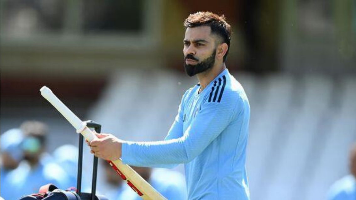
యాదవ్ హ్యాట్ రికార్డు సాధించాడు. ఆ మ్యాచ్ లో రోహిత్ శర్మచే క్రికెట్ లో ఎనిమిదోసారి 150 ప్లస్ పరుగులు సాధించాడు. కాబట్టి విరాట్ కోహ్లా ఒక మైలురాయిని సాధించినప్పుడల్లా, అతని కంటే ఇతరులకు ప్రయోజనం ఉంటుంది. ఈసారి 500వ అంతర్జాతీయ క్రికెట్ మ్యాచ్ ఆడబోతున్న విరాట్ కోహ్లా ఏదైనా రికార్డు సృష్టించాడా? సాధారణంగా ఇతర ఫైయర్లు ఏదైనా రికార్డు క్రియేట్ చేస్తారా అని ఫ్యాన్స్ ఉత్సాహం చూస్తున్నారు. విరాట్ కోహ్లా 499 మ్యాచ్ లు

వెస్టిండీస్ తో రెండో టెస్టు మ్యాచ్ గురువారం 20న జరగనుంది. అంతర్జాతీయ క్రికెట్ లో విరాట్ కోహ్లాకి ఇది 500వ మ్యాచ్. అయితే కోహ్లా ఓ మైలురాయి దగ్గరకు వస్తే.. అది ఇతర ఆటగాళ్లకు కలిసి వస్తుంది. విరాట్ కోహ్లా ఎప్పుడైతే ఒక పెద్ద మైలురాయిని తాకబోతున్నాడో, అది అతని కంటే ఇతరులకు ఎల్లప్పుడూ ఎక్కువ అదృష్టం. ఎందుకంటే.. కోహ్లా ఓ రికార్డు సృష్టించబోతున్నాడంటే.. ఆ మ్యాచులో ఇతర ఆటగాళ్లకే కలిసి వచ్చింది. ఇప్పుడు వెస్టిండీస్ తో జరిగే మ్యాచులో ఏం జరుగుతుందో చూడాలి. గతంలో చూసుకుంటే... విరాట్ కోహ్లా తన 100వ అంతర్జాతీయ మ్యాచ్ ఆడుతున్నప్పుడు బంగ్లాదేశ్ పై 66 పరుగులు చేశాడు. అయితే అదే మ్యాచ్ లో సబిన్ బెండూల్యార్ 100వ సెంచరీ పూర్తి చేసి ప్రపంచ రికార్డు సృష్టించాడు. విరాట్ కోహ్లా తన 200వ మ్యాచ్ ఆడుతూ శ్రీలంకపై 49 పరుగులు చేశాడు. కానీ అదే మ్యాచ్ లో రాయుడు తన తొలి సెంచరీని పూర్తి చేశాడు. అదేవిధంగా విరాట్ కోహ్లా తన 300వ క్రికెట్ మ్యాచ్ లో శ్రీ లంకపై కేవలం 4 పరుగులు మాత్రమే చేశాడు. అయితే ఆ మ్యాచ్ లో ధోనీ, భువనేశ్వర్ కుమార్ ఎనిమిదో వికెట్ కు వంద పరుగులు జోడించి జట్టును విజయతీరాలకు చేర్చాడు. వెస్టిండీస్ తో జరిగిన 400వ అంతర్జాతీయ క్రికెట్ మ్యాచ్ లో విరాట్ కోహ్లా టెటయూడు. ఇదే మ్యాచ్ లో కల్లీస్