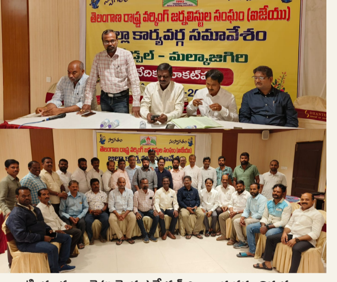
టీ యు డబ్ల్యూ జే (ఐ జే యు) మేడ్చల్ జిల్లా కార్యవర్గం నిర్ణయం జయభేరి, హైదరాబాద్ :