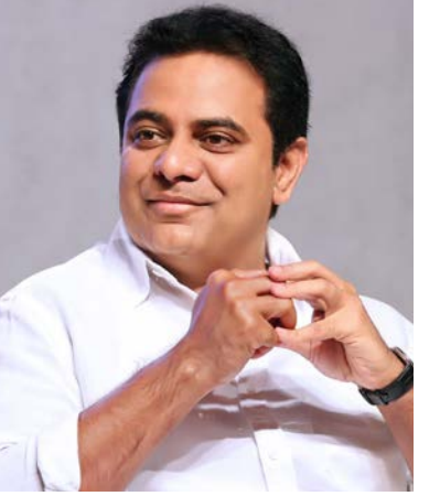
ప్రధాన లక్ష్యం ప్రాణ నష్టం జరగకుండా చూడడమేనని.. హైదరాబాద్ కు రెడ్ అలర్ట్ ఉన్న నేపథ్యంలో ప్రభుత్వం అన్ని రకాల ప్రయత్నాలు చేస్తుందన్నారు. హైద

జయభేరి, హైదరాబాద్ : రాష్ట్ర వ్యాప్తంగా కురుస్తున్న భారీ వర్షాలతో తీసుకోవాల్సిన జాగ్రత్తలపై పురపాలక శాఖ మంత్రి కే తారక రామారావు సమీక్ష నిర్వహించారు. రాష్ట్రంలో కురుస్తున్న భారీ వర్షాలను గౌరవ ముఖ్యమంత్రి ఎప్పటికప్పుడు సమీక్షిస్తున్నారు.. పురపాలక శాఖ అధికారులతోనూ కూడా ముఖ్యమంత్రి ప్రత్యేకంగా మాట్లాడారని తెలిపారు. ల హైదరాబాద్ నగరంలోనూ జిఎస్ టీఎన్ కమిషన్ల మరయు ఇతర ఉన్నతాధికారులు... క్షేత్రస్థాయిలో ఉన్న కిందిస్థాయి సిబ్బంది వరకు అందరూ పనిచేస్తున్నారు. పురపాలక ఉద్యోగుల అన్ని సెలవులను రద్దు చేయడం జరిగింది. పరిస్థితిని ఎప్పటికప్పుడు పోస్ట్ డ్యూరా ఇతర మాధ్యమాల ద్వారా సమీక్షిస్తున్నామన్నారు. కుంభవృష్టిగా వర్షం పడడం ఎదతెరిపి లేకుండా వర్షం కురవడం వలన ప్రజలకు కొంత ఇబ్బంది ఎదురవుతున్నదని తెలిపారు. ఇప్పటి దాకా ఎలాంటి ప్రాణానష్టం జరగకుండా సాధ్యమైనవి ఎక్కువ జాగ్రత్తలు తీసుకోవడం జరిగిందని తెలిపారు.