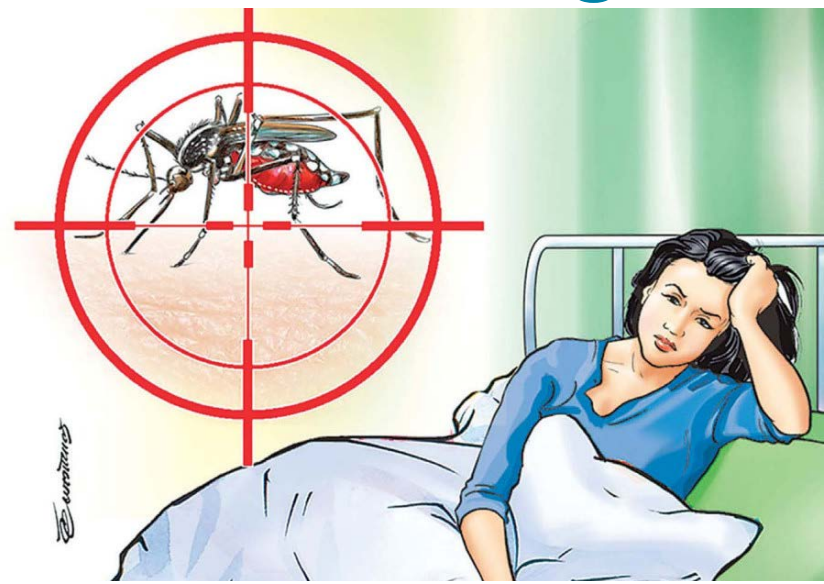
యొ కలబంద సహజ పదార్థాలతో తయారైన చేసిన ముసల్నీ రిపెలెంట్స్ మార్కెట్లో అందుబాటులో ఉంటాయి. పయస్కుతో సంబంధం లేకుండా ఎవరైనా వాటిని ఉపయోగించుకునేందుకు అవకాశం ఉంది. ఈ స్యచ్ఛైన్లు సిట్లోనెడ్డా, యూకలిప్టస్ అయిల్ రాబల్ గ్రెయ్ చుక్కలు దుస్తులపై వేసినా దోమల బారిన పడకపోతారు.

పర్యాకాలం నేపథ్యంలో డెంగ్యూ విజృంభిస్తున్నది. దేశ రాజధాని ఢిల్లీ, ఏపీతో సహా పలు రాష్ట్రాల్లో డెంగీ జ్వరాలు నమోదవుతున్నాయి. డెంగ్యూ జ్వరం దోమల ద్వారా సంక్రమించే వైరల్ వ్యాధి. ప్రధానంగా ఈడీని దోమల ద్వారా వ్యాప్తిస్తుంది. డెంగ్యూ సోకిన సమయంలో అధిక జ్వరం, తీవ్రమైన తలనొప్పి, కీళ్లు, కండరాల నొప్పి, దద్దుర్లు, పూ వంటి లక్షణాలుంటాయి. తీవ్రమైన సందర్భాల్లో.. డెంగ్యూ హెపాటిటిస్ జ్వరాలకి దారితీస్తుంది. ఇది ప్రాణాంతక పరిస్థితిని తలెత్తుతుంది వైద్యులు పేర్కొంటున్నారు.