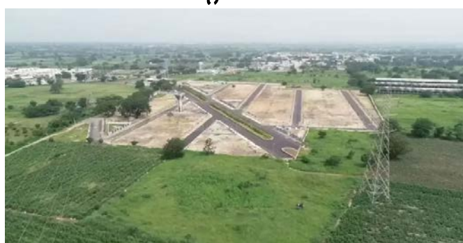
జయభేరి, హైదరాబాద్ :

మోకెల ప్లాట్లకు నాల్గో రోజూ భారీ డిమాండ్