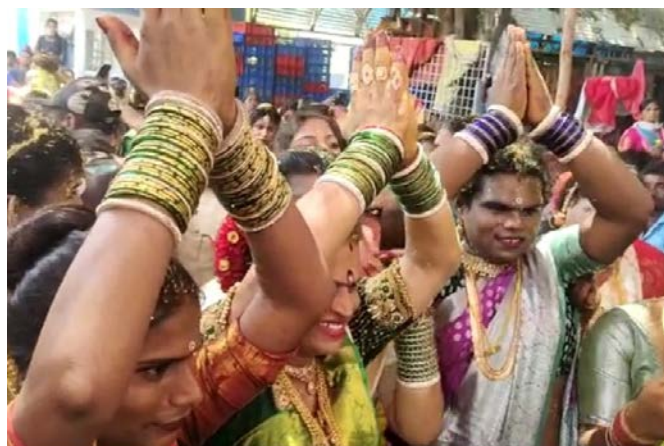
జయభేరి, కరీంనగర్, సెప్టెంబర్ 7

రాజస్థాన్ సిరిస్టిల్ల జిల్లా వేములవాడ ఆలయాన్ని దక్షిణ కాశీగా పిలుస్తుంటారు. ఈ ఆలయానికి వేయి సంవత్సరాల చరిత్ర ఉంది. నిత్యం ఆలయంలో భక్తుల రద్దీ ఉంటుంది. ప్రతి ఏటా భక్తుల సంఖ్య పెరుగుతునే ఉంది. ఈ ఆలయంలో శివపార్వతులకు ప్రత్యేక స్థానం ఉంది. గతంలో జోగినిగా మారి స్వామి వారికి అంకితమయ్యేవారు. అదే సమయంలో చాలా ఏళ్ల నుంచి శివపార్వతులుగా మారుతున్నవారు ఉన్నారు. దాదాపు ప్రతి గ్రామంలో శివపార్వతులు ఉంటారు. ఏమైనా అనారోగ్య నుంచి బయటపడితే శివపార్వతులుగా మారుతుంటారు. దేవుడికి మొక్కుకొని మంచి జరిగితే శివపార్వతులుగా మారుతారు. అటు.. మీగతా 2 లో