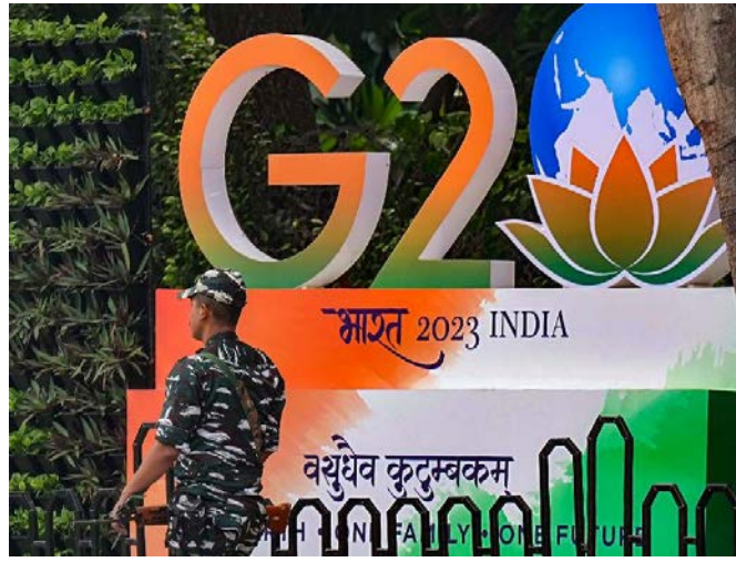
జయభేరి, న్యూఢిల్లీ, సెప్టెంబర్ 7

జీ20 సదస్సు నేపథ్యంలో ఢిల్లీ ఇప్పటికే భద్రతా వలయంలోకి జారుకుంది. ఈ నేపథ్యంలో ఈ నెల 9,10 తేదీల్లో ఏవి మూతపడి ఉంటాయి? ఏవి ఓపెన్గా ఉంటాయి? అన్న వివరాలను ఇక్కడ తెలుసుకోండి. జీ20 సదస్సు కోసం దేశ రాజధాని ఢిల్లీ సన్నద్ధమవుతోంది. ఈ నెల 9, 10 తేదీల్లో జరగనున్న ఈ ముఖ్యమైన ఈవెంట్ కోసం అధికారులు భారీ స్థాయిలో భద్రతా ఏర్పాటు చేశారు. ఢిల్లీ మొత్తం ఇప్పటికే భద్రతా వలయంలోకి జారుకుంది. ఈ రెండు రోజుల పాటు అనేక సేవలు స్తంభించిపోనున్నాయి. ఈ నేపథ్యంలో ఈ నెల 9,10 తేదీల్లో ఢిల్లీలో ఏవి ఓపెన్ ఉంటాయి? ఏవి మూతపడి ఉంటాయి? వంటి వివరాలను ఇక్కడ మీగతా 2 లో