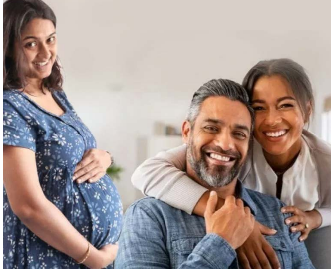
జయభేరి, హైదరాబాద్, సెప్టెంబర్ 7

హైదరాబాద్ లో సరోగసి పేరుతో జరుగుతున్న అక్రమాలు మరోసారి వెలుగుచూశాయి. ఇక్కడ ఎప్పటి నుంచో అద్దె గర్భాల వ్యాపారం జరుగుతోంది. కేంద్రం నిషేధించినా అక్రమార్కులు.. సరోగసిని వ్యాపారాన్ని వదలడంలేదు. రాబడి వీపరీతం ఉంటుందని కనుక.. కాబట్టి గుట్టు చప్పుడుకాకుండా అద్దె గర్భదారణ అరేంజ్ చేస్తున్నారు. ఇందులో ఎక్కువగా పేద మహిళలే టార్గెట్ చేస్తున్నారు. దబ్బు ఇచ్చామని ఆశ చూపి వారిని... మీగతా 2 లో