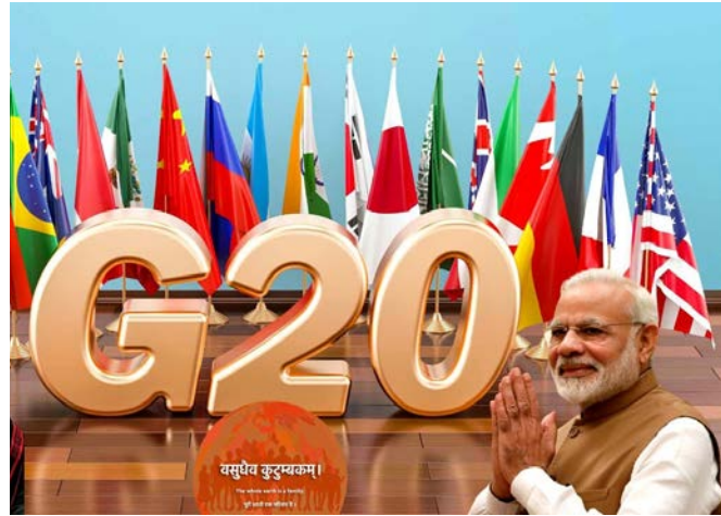
జయభేరి, న్యూఢిల్లీ, సెప్టెంబర్ 8

ఢిల్లీలో జరగనున్న జీ 20 సదస్సుకి ప్రపంచ దేశాల అధినేతలతో పాటు కీలక నేతలు హాజరు కానున్నారు. అమెరికా అధ్యక్షుడు జో బైడెన్, యూకే ప్రధాని రిషి సునాక్ తో పాటు మరి కొన్ని దేశాల లీడర్స్ ఢిల్లీకి తరలి వస్తున్నారు. సభ్య దేశాల అధినేతలందరికీ భారత్ ఆహ్వానం పంపినప్పటికీ కొందరు మాత్రం హాజరు కావడం లేదు. రకరకాల కారణాల వల్ల హాజరు కాలేక పోతున్నట్లు ఇప్పటికే అధికారికంగా ఆయా దేశాలు ప్రకటించాయి. వీరిలో చైనా అధ్యక్షుడు జిన్ పింగ్ తో పాటు రష్యా అధ్యక్షుడు పుటన్ ఉన్నారు. జో బైడెన్ ఇప్పటికే ఢిల్లీకి బయల్దేరినట్లు అమెరికా వెబ్సైటు వివరించింది. జీ 20 సదస్సుకి హాజరయ్యేందుకు ఢిల్లీకి వస్తున్నట్లు మిగతా 2 లో