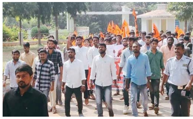
జయభేరి, వరంగల్ :