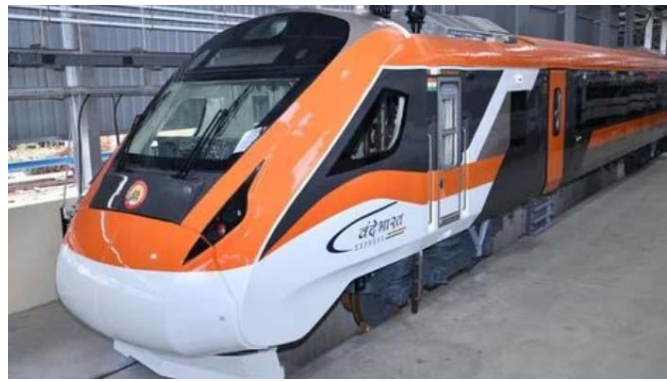
జయభేరి, న్యూఢిల్లీ, సెప్టెంబర్ 13

దేశంలోనే అత్యంత వేగవంతమైన రైలుగా వందే భారత్ ఎక్స్ ప్రెస్ ప్రత్యేక గుర్తింపును పొందింది. కేంద్ర ప్రభుత్వం ఎంతో ప్రతిష్టాత్మకంగా చేపట్టిన కార్యక్రమం వందేభారత్. కాగా, దేశంలో త్వరలో మరో 9 వందే భారత్ ఎక్స్ ప్రెస్ రైళ్లు అందుబాటులోకి రానున్నాయని భారతీయ రైల్వే తెలిపింది. వందేభారత్ రైళ్లు ప్రస్తుతం దేశవ్యాప్తంగా 25 రూట్లలో నడుస్తున్నాయి. అంతే కాకుండా మరో 9 రైళ్లను ప్రవేశపెట్టాలని భారతీయ రైల్వే యోచిస్తోంది. త్వరలో పట్టాలెక్కనున్న ఈ కొత్త రైళ్లను చెన్నైలోని ఇంటిగ్రల్ కోచ్ ఫ్యాక్టరీలో తయారు చేసినట్లుగా సమాచారం. ట్రాక్ టెస్టింగ్ కోర్సులలో ఎక్కువ భాగం ఈ ఏడాది అసెంబ్లీ ఎన్నికలకు వెళ్లనున్న రాజస్థాన్, మధ్యప్రదేశ్ లకు వెళ్తాయి. ఇందుకోసం రైల్వే మంత్రిత్వ శాఖ రెండు రాష్ట్రాల్లోనూ భారీ కార్యక్రమాలను నిర్వహించే అవకాశాలు