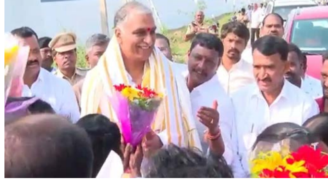
పదివేల మందికి గృహలక్ష్య ఇండ్లు సాంక్షన్ చేశాడు ముఖ్యమంత్రి కేసీఆర్