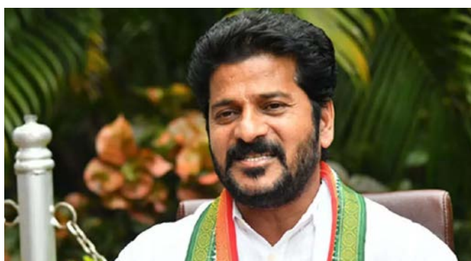
న్యూఢిల్లీ, అక్టోబరు 3

ఓటుకు నోటు కేసులో టీఎన్ఎస్ టీవీ రేవంత్ రెడ్డికి సుప్రీంకోర్టులో చుక్కెదురైంది. ఓటుకు నోటు కేసు అవినీతి నిరోధక చట్టం పరిధిలోకి రాదని, పీసీబీ పరిధిలోకి రాదంటూ రేవంత్ రెడ్డి సుప్రీం కోర్టులో పిటిషన్ దాఖలు చేశారు. ఈ పిటిషన్ పై విచారణ చేపట్టిన ధర్మాసనం.. ఇరు వర్గాల వాదనలు వినింది. ఈ కేసులో ప్రాథమిక సాక్ష్యాలు ఉన్నాయని, అన్నీ విషయాలు త్రువలో కోర్టుకు ఇచ్చామని తెలంగాణ ప్రభుత్వం తరపు లాయర్లు వాదించారు. ఈ కేసు పీసీబీ పరిధిలోకి రాదని, కేసును కొట్టివేయాలని రేవంత్ రెడ్డి తరపు న్యాయవాదులు మిగళా 2 లో