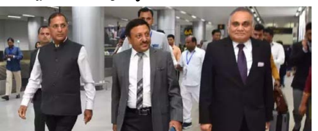
హైదరాబాద్, అక్టోబరు 3

వివిధ రాజకీయ పార్టీల ప్రతినిధులు, కలెక్టర్లు, ఎస్పీలు, ప్రభుత్వ ప్రధాన కార్యదర్శి, డీజీపీతో సమావేశం