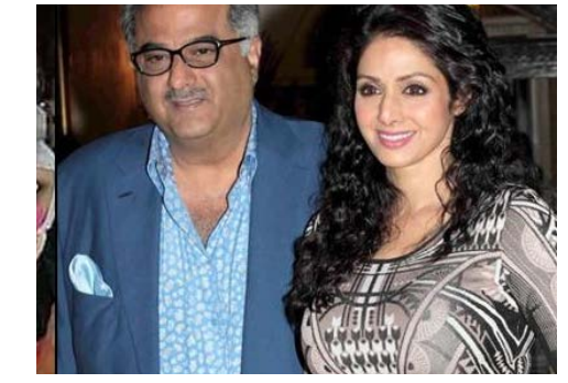
ముంబై, అక్టోబరు 3

అతిథిలో సుందరి శ్రీదేవి ఈ రోజు విడిచి పోయిన అవుతోంది. బంధువుల వివాహ వేడుక కోసం దుబాయ్ వెళ్లిన ఆమె హోటల్ బాత్ టబ్ లో విగతజీవిగా కనిపించడం పాకీకు గురి చేసింది. తాజాగా శ్రీదేవి భర్త బోన్ కపూర్ శ్రీదేవి మరణం గురించి కొన్ని తీలక అంశాలు చెప్పారు. తాజాగా ఇచ్చిన ఓ ఇంటర్వ్యూలో బోన్ కపూర్ మాట్లాడుతూ "శ్రీదేవిది నేచురల్ డెత్ కాదు. యాక్సిడెంటల్ డెత్. ఆమె మరణానంతరం దుబాయ్ పోలీసులు నన్ను 24 గంటల పాటు విచారించి, లై డిక్టర్ పరీక్షలు కూడా చేశారు. ఇండియన్ మీడియా నుంచి ఒత్తిడి ఎక్కువగా ఉన్న మిగళా 2 లో