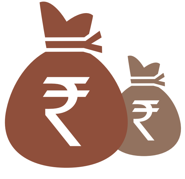
న్యూఢిల్లీ, అక్టోబరు 11:

వచ్చే ఏడాది దేశంలో లోక్ సభ ఎన్నికలు జరగనున్నాయి. ఈ స్థితిలో కేంద్ర ప్రభుత్వ ఉద్యోగులను ఆదుకోవాలన్న చిరకాల డిమాండ్ అయిన తదుపరి వేతన సంఘాన్ని ప్రభుత్వం ఏర్పాటు చేస్తుందని భావిస్తున్నారు. జి.ఎం.ఎ. పేరుతో సంఘం ఏర్పాటు 10 ఏళ్లు వేచి ఉంచాల్సిన అవసరం లేదని ప్రభుత్వం పేర్కొంది. వారి పనితీరు ఆధారంగా ప్రతి సంవత్సరం వారి వేతనాన్ని సవరించాలి. దీన్ని 7వ వేతన సంఘంలోనే సిఫార్సు చేసింది. వేతనాల పెంపునకు వేతన కమిటీ వేయాల్సిన అవసరం లేదని కూడా చెబుతున్నారు. ఈ అంశాలన్నింటినీ దృష్టిలో ఉంచుకుని ప్రభుత్వం కొత్త మార్గాన్ని ప్లాన్ చేస్తోందని కూడా అంటున్నారు. అయితే మిగతా 2 లో