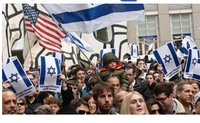
ఇజ్రాయెల్ అక్టోబర్ 11

ఇజ్రాయెల్ హమాస్ యుద్ధం ఐదో రోజుకు చేరుకుంది. అక్టోబర్ 6న ప్రారంభమైన ఈ యుద్ధంలో హమాస్ పై ఇజ్రాయెల్ క్రమంగా పైచేయి సాధిస్తోంది. వారి ఆధీనంలో ఉన్న ప్రాంతాలను తిరిగి తమ ఆధీనంలోకి తీసుకుంటోంది. తాజాగా గాజా సరిహద్దులోని దక్షిణ ఇజ్రాయెల్ ను హమాస్ ఉగ్రవాదుల నుంచి తిరిగి స్వాధీనం చేసుకున్నట్లు మిగతా 2 లో