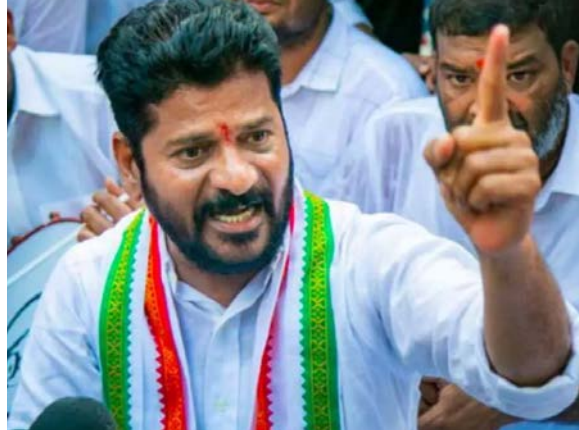
జయభేరి, హైదరాబాద్ :