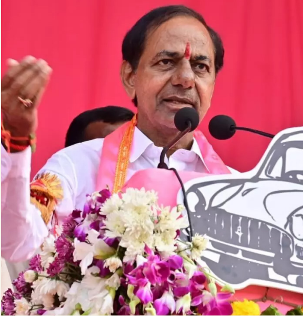
జయభేరి, కరీంనగర్, నవంబర్ 17

కరీంనగర్లో జరిగిన ప్రజా ఆశీర్వాద సభలో సీఎం కేసీఆర్