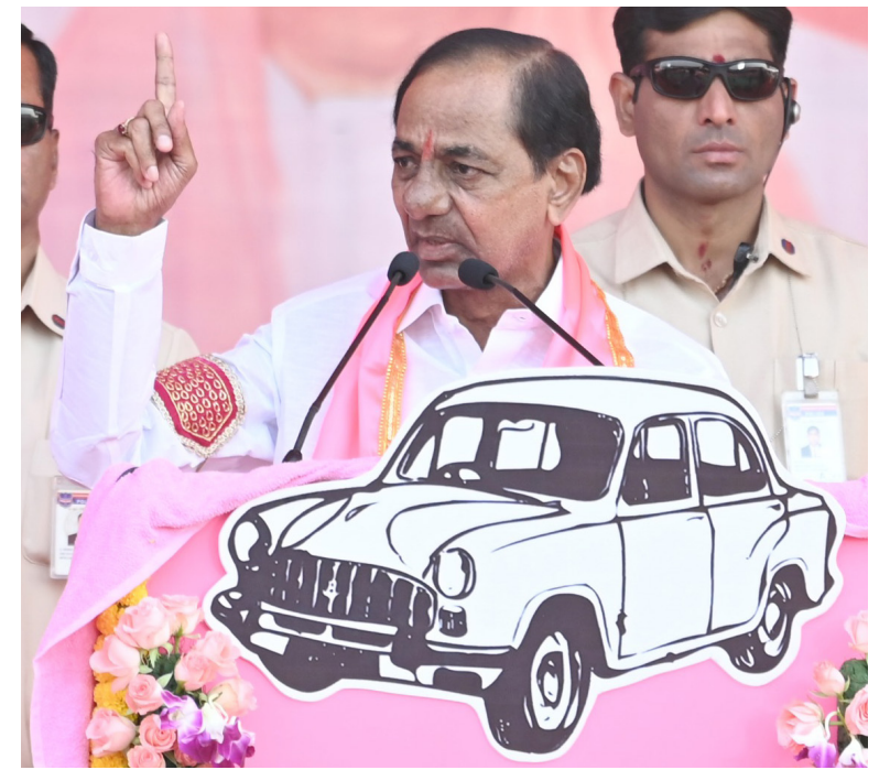
జయభేరి, మధిర, నవంబర్ 21

మధిర నియోజకవర్గం బీఆర్ఎస్ ప్రజా ఆశీర్వాద సభలో కేసీఆర్