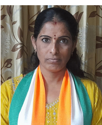
ఆరు గ్యారంటీలు అమలు చేస్తారని అన్నారు. ముక్త్యంగా 1) మహాలక్ష్మి పథకంలో మహిళలకు అర్ టి సి బస్సులో ఉచిత ప్రయాణం, నెలకు 2500 రూపాయలతోపాటు, 500 రూ గ్యాస్ బండ్ అందిస్తారని అన్నారు. 2) ఇందిర