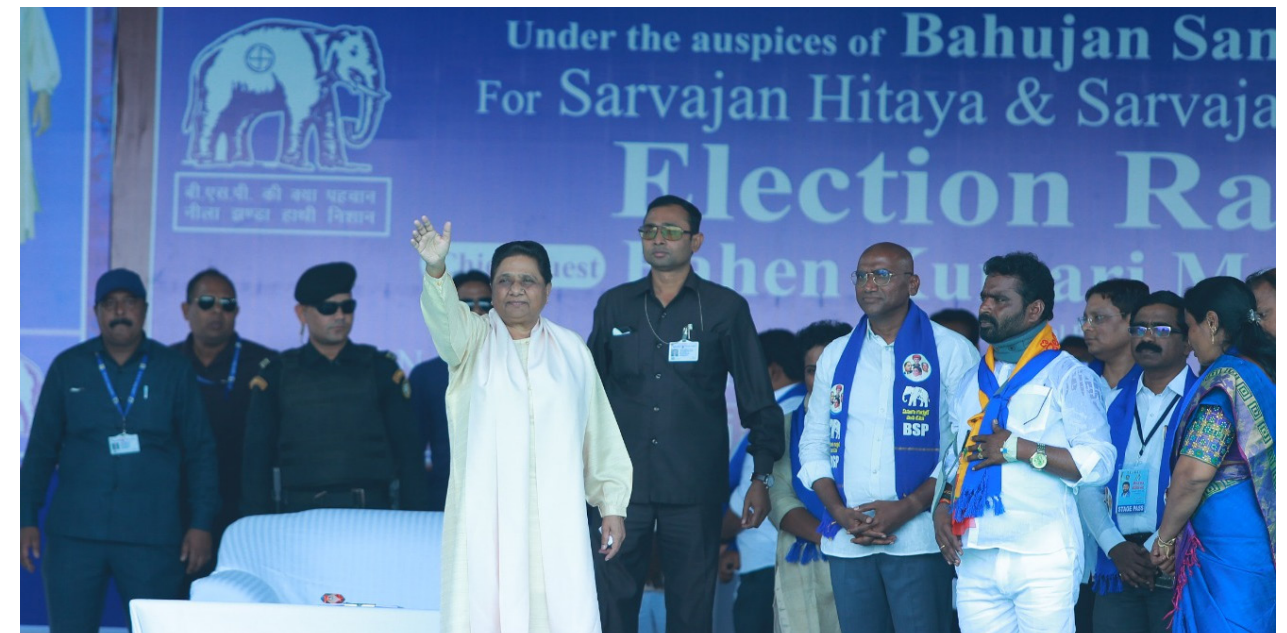
పోరాటం చేసి కాంగ్రెస్ వ్యతిరేకించిన అంబేద్కర్ కు