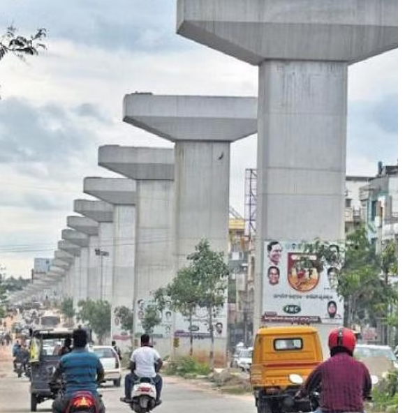
జయభేరి, ఉప్పల్ : డిసెంబర్ 27: ఉప్పల్ పై ఒకవర నిర్మాణ సంస్థ చేసిన తప్పిదాలకు వాహనదారులు తీవ్ర ఇబ్బందులు పడుతున్నారు.

జయభేరి, న్యూఢిల్లీ, డిసెంబర్ 27 వచ్చే ఏడాది జనవరి 14 నుంచి రాహుల్ గాంధీ రెండో దశ జోడో యాత్ర ప్రారంభించనున్నారు. ఈ సారి ఈ యాత్రకు 'భారత్ న్యూయ్ యాత్ర' అనే పేరు పెట్టారు. మణిపూర్ నుంచి ముంబయి వరకు రాహుల్ పాదయాత్ర చేయనున్నారు. మొత్తం 14 రాష్ట్రాల్లో ఈ యాత్ర కొనసాగుతుంది. మార్చి 20న యాత్ర ముగియనుంది. 6,200 కిలోమీటర్ల మేర యాత్ర కొనసాగుతుంది. భారత్ జోడో యాత్రలో ఎదురైన అనుభవాలతో రెండోసారి రాహుల్ గాంధీ పాదయాత్రను ప్రారంభించనున్నారు. ఈ సారి యువత, మహిళలతో పాటు అన్ని వర్గాలతోనూ ఆయన మాట్లాడతారు. మొత్తం 6,200 కిలోమీటర్ల మేర రాహుల్ గాంధీ. ఈ సారి మాత్రం హైదరాబాద్, నాగార్జున, అనంతపురం, మహారాష్ట్రలో ముగిస్తుంది. ఈ సారి కాలినడకనే కాకుండా బస్లో యాత్ర కొనసాగుతుంది. "గతేడాది సెప్టెంబర్ 7వ తేదీన పస్ట్ ఫేజ్ జోడో యాత్ర కన్యాకుమారి నుంచి మొదలైంది. దాదాపు 12 రాష్ట్రాల మీదుగా 4 వేల కిలోమీటర్ల మేర సాగిన ఈ యాత్ర కళ్ళిద్దో ముగిసింది. దాదాపు 136 రోజుల పాటు రాహుల్ గాంధీ ఈ యాత్ర చేశారు. అయితే... పస్ట్ ఫేజ్ పూర్తిగా పాదయాత్ర చేశారు న్యూఢిల్లీ. ఇటీవల జరిగిన 5 రాష్ట్రాల ఎన్నికల్లో మూడు రాష్ట్రాల్లో కాంగ్రెస్ ఓటమి పడింది. ఫ్రాన్స్, మధ్యప్రదేశ్, రాజస్థాన్లో బీజేపీ అధికారంలోకి వచ్చింది. ఈ ఫలితాలతో కాంగ్రెస్ మరోసారి అత్యధిక శీలంతో పడింది. లోక్సభ ఎన్నికల్లో కచ్చితంగా పుంజుకోవాలని లక్ష్యంగా పెట్టుకుంది. ఇందులో భాగంగానే రాహుల్ గాంధీ రెండోసారి జోడో యాత్ర నిర్వహించనున్నారు.