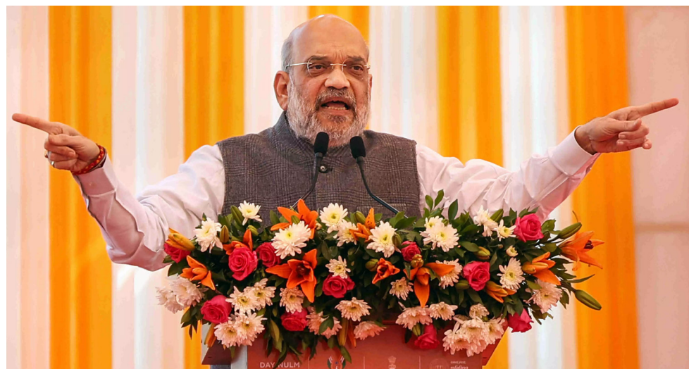
జయభేరి, హైదరాబాద్, డిసెంబర్ 27: తెలంగాణలో దబుల్ డిజిట్ సాధించడమే లక్ష్యంగా మార్చిన ప్లాన్...

కొడితే దిమ్మతిరిగిపోవాలే. అంటోంది కమలం పార్టీ మొన్నటి అసెంబ్లీ ఫలితాల ఇచ్చిన బాస్టెట్. భారీగా పార్లమెంట్ సీట్లు కొల్లగొట్టేలా పూహలు రచిస్తోంది కామెయంట్. తెలంగాణలో పది అసెంబ్లీ సీట్లు గెలవడమే లక్ష్యం బీజేపీ పూహలు రచిస్తోంది. దీనిపై రోడ్ మాన్ ఇచ్చేందుకే బీజేపీ కా ప్లాన్ షా... అమిత్ షా హైదరాబాద్ అడుగుపెట్టబోతున్నారు. ఈ గురువారం జరగబోయే సమావేశంలో అసెంబ్లీ ఎన్నికలపై యేదయేమీ కాకుండా లోక్సభ ఎన్నికల్లో పార్టీ సన్నద్ధతపై శ్రేణులకు దిశానిర్దేశం చేయబోతున్నారు. ఇంతకీ అమిత్ షా రచించబోయే రాజకీయ తంత్రమేంటి? తెలంగాణ లోక్సభ బరిలో దిగబోయే ఆ 17 మంది నేతలెవరు? అన్నది హాట్ టాపిక్. ఇలా అసెంబ్లీ ఎన్నికలు పూర్తయ్యాయా లేదో. అలా పార్లమెంట్ ఎన్నికలపై ఫోకస్ పెట్టింది కమలం పార్టీ. మొన్నటి అసెంబ్లీ ఎన్నికల్లో లార్డెస్ రీట్ అవకాశం వచ్చింది. ఫలితాలపై బీజేపీ అగ్రనాయకత్వం కొంత సంతోషంగానే ఉంది. 2018 ఎన్నికలలో పోలిస్, సీట్లు, ఓట్లు భారీగా పెరగడం ఆ పార్టీ శ్రేణుల్లో ఉత్సాహం పెంచింది. దీంతో అసెంబ్లీ ఎన్నికలకు రెట్టించిన ఉత్సాహంతో పార్లమెంట్ ఎన్నికలకు సిద్ధమవుతున్నారు తెలంగాణ కామెయంట్. 2018 అసెంబ్లీ ఎన్నికల్లో బీజేపీ గెలిచింది కేవలం ఒకే ఒక అసెంబ్లీ స్థానం. కానీ ఆ తర్వాత జరిగిన పార్లమెంట్ ఎన్నికల్లో ఏకంగా నాలుగు ఎంపీ స్థానాల్లో తెండా ఎగిరింది. ఇప్పుడు ఏకంగా 8 ఎమ్మెల్యే సీట్లు గెలవడం, 19 నియోజకవర్గాల్లో సెకండ్ ఫ్లైన్ రావడంతో, పార్లమెంట్ ఎన్నికలపై ప్రత్యేక ఫోకస్ పెట్టింది కమలం పార్టీ. ఎంపీ ఎన్నికల్లో