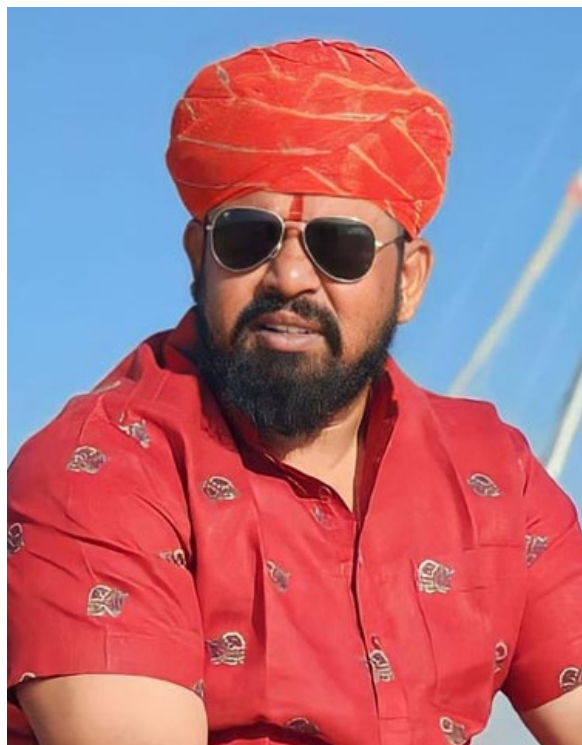
జయభేరి, హైదరాబాద్, జనవరి 3: