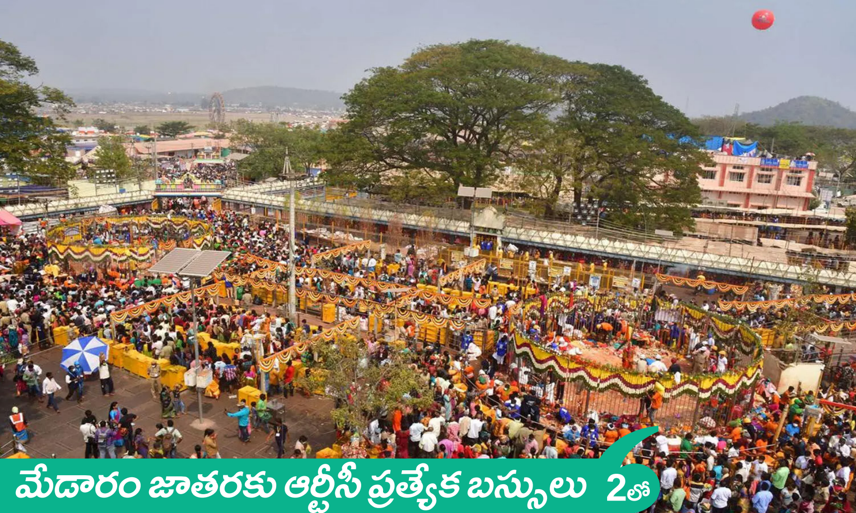
మేడారం జాతరకు ఆర్టీసీ ప్రత్యేక బస్సులు 2 వో