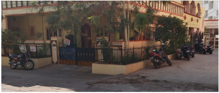
ఎల్సీనగర్ మున్సిపాలిటీలోని పన్నులిపురం సాయినాథ్ కాలనీ రోడ్ నెంబర్ ఏడలో ఓ స్థానికుడు గవర్నమెంట్