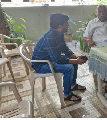
ఓ జయభేరి, కామారెడ్డి మర్రి 3 :

ప్రతి ఒక్క బీకాడీ, టిబీసీ చేసిన అభ్యర్థులు ఉపా ధ్యాయ అర్హత పరీక్ష (టిబి )లో అర్హత సాధిం చాలి ఉంది. కావున ఈ ఉపాధ్యాయ అర్హత పరీక్షలో ఓసీ అభ్యర్థులకు 90 మార్కులు, బీసీ అభ్యర్థులు 75 మార్కులు, ఎస్సీ ఎస్సీ అభ్యర్థు లు 60 మార్కులు సాధించాలి. దీంతో 89 మార్కులు సాధించిన ఈడబ్ల్యూఎస్ రిజర్వేషన్ అర్హత కలిగిన అభ్యర్థులు ఒక్క మార్కుతో వేల సంఖ్యలో అభ్యర్థులు, ఉపాధ్యాయ పోస్టుల కొరత నిర్వహించే పరీక్షల్లో తీవ్ర అన్యాయం జరుగుతుంది. కావున ఈడబ్ల్యూఎస్ 10% రిజర్వేషన్ కు అర్హత కలిగిన అగవర్త పేదలకు కూడా బీసీ అభ్యర్థుల మాదిరిగా 75 మార్కులకే టిబి అర్హత పరీక్ష మాన్యులు తగ్గించాలని వారు డిమాండ్ చేశారు. తెలంగాణ ముఖ్యమంత్రి ఈ సమస్యపై దృష్టి సారించి పరిష్కరించి అర్హతైన ఈడబ్ల్యూఎస్ రిజర్వేషన్ అభ్యర్థులకు తగిన న్యాయం చేయాలని కోరారు.