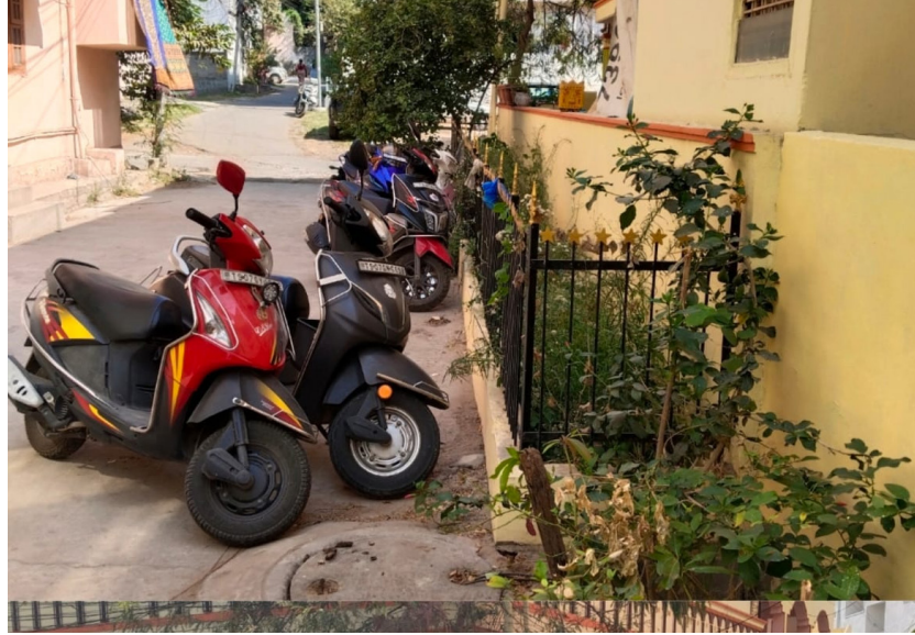
విద్యురంగా ఉందని స్థానికులు తెలిపారు. రోడ్డుని కట్టా చేసి ఇన్ఫార్మింగ్ గోడ కట్టుకున్న ఈ కట్టా బాగా తొన్నీ రూపుమాపేందుకు ఏ అధికారి స్పందించకపోవడం ఆశ్చర్యంగా ఉందని స్థానికులు తీవ్ర ఆగ్రహానికి లోన

రోడ్డును అరుక్ష్ణు కట్టాచేశాడు. కట్టా చేసిన చోట ఎవరు బండి పార్కు చేయొద్దు అని సార్వబౌద్ధిక అక్కడ చెట్లు మొక్కలు పెంచుతూ తానే గొప్ప పని చేస్తున్నట్లు నటిస్తున్నాడు ఈ స్థానికుడు... రాజకీయ అంద ఉండో అధికారుల దయరాక్షిణ్యాలూ ఉన్నాయో తెలియదు కానీ.. ఈ విషయంపై అధికారులు తెలిసినా తెలియన దట్టికి రాలేదా? అని ప్రజలు అయోమయాలికి గర వుతున్నారు. సంవత్సరాలుగా ప్రభుత్వ భూములను, పంట పొలాలను కట్టా చేయడం చూశాం! కానీ ఇలా ఓ స్థానికుడు గల్గితే రోడ్డు ప్రదక్షిణ ప్రావృద్ధిని కట్టా చేయడం