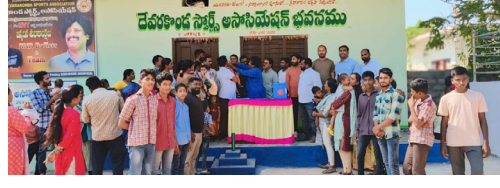
ఓ జయభేరి, దేవరకొండ :