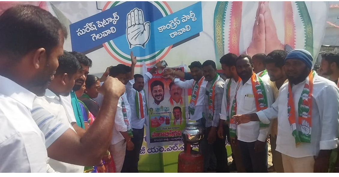
ఓ జయభేరి, కామారెడ్డి మర్రి 3 :