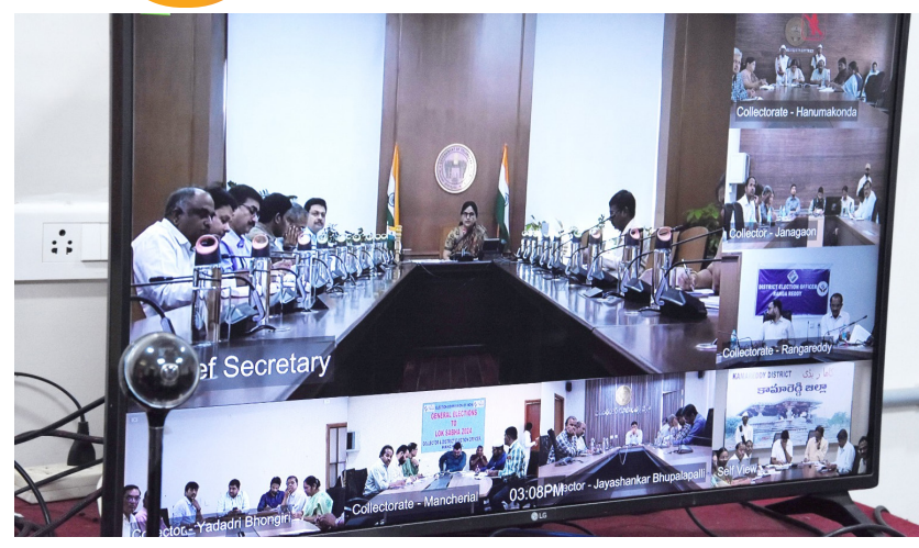
లని కోరారు. ధాన్యం కోనుగోలు కేంద్రాలకు నిర్దేశిత షెడ్యూల్ ప్రకారం రైతులు ధాన్యాన్ని తీసుకుని వచ్చే విధంగా ప్రజాళికాబద్ధంగా చర్యలు తీసుకోవాలని కలెక్టర్ తెలిపారు. జిల్లాలో పరిపాగు చేస్తున్న రైతులకు సమీపంలో ధాన్యం కోనుగోలు కేంద్రాలకు ట్యాగింగ్ చేయాలని, ప్రజాళిక బద్ధంగా కోనుగోలు కేంద్రం వద్దకు ధాన్యం తెచ్చే విధంగా చర్యలు తీసుకోవాలని కలెక్టర్ సూచించారు. ఖరీఫ్ 202324 సీజన్ కు సంబంధించి సీఎంఆర్ రా రైస్ భారత అవారం సంస్థకు

కోతలకు అనుగుణంగా ప్రారంభించాలని చెప్పారు. ఎక్కడ ప్రజాప్రతినిధులు జోక్యం చేసుకోకుండా చూడాలని, అధికారులు ఎప్పటికప్పుడు క్షేత్రస్థాయి తనిఖీలు నిర్వహిస్తూ రైతుల వద్ద నుంచి మద్దతు ధర పై ఎక్కడ ఇబ్బందులేకుండా కోనుగోలు ప్రక్రియ ప్రజాళిక బద్ధంగా పూర్తి చేయాలని సూచించారు. జిల్లాలో 347 ధాన్యం కోనుగోలు కేంద్రాల ద్వారా ధాన్యం దిగుబడి మద్దతు ధరపై కోనుగోలు చేసేందుకు ప్రజాళికలకు సిద్ధం చేసుకున్నామని తెలిపారు. యాసంగి సీజన్లు గ్రేడ్ ఏ రకం ధాన్యానికి క్లింటాక్ష 2 వేల 203 రూపాయలు, సాధారణ రకం ధాన్యానికి క్లింటాక్ష 2 వేల 183 రూపాయల మద్దతు ధర చెల్లించనున్నట్లు తెలిపారు. జిల్లాలోని ప్రతి ధాన్యం కోనుగోలు కేంద్రం వద్ద అవసరమైన మౌళిక వసతులు, టూల్స్, ఇన్స్ట్రుమెంట్స్, నర్సు, వేయింగ్ యంత్రాలు, ప్యాకీ క్లియర్ చేయాలని, ధాన్యం నాణ్యత ప్రమాణాలు, తేమ శాతం 17 లోపు ఉండాలనే అంశాలపై రైతులకు విస్తృత ప్రచారం కల్పించాలని కలెక్టర్ తెలిపారు. ధాన్యం కోనుగోలు నిమిత్తం అవసరమైన వాహనాలు అందుబాటులో ఉండేలా చర్యలు తీసుకోవాలని, సకాలంలో ధాన్యాన్ని కోనుగోలు కేంద్రాల నుంచి సంబంధిత మిల్లర్లకు కేటాయించాలని, రైస్ మిల్లు వద్ద ఎత్తి పరిస్థితుల్లో ధాన్యం కోత రాకుండా చర్యలు తీసుకోవాలని అన్నారు. ధాన్యం కోనుగోలు కేంద్రాల వద్ద రైస్ మిల్లర్ల వద్ద హామీల కోత రాకుండా జాగ్రత్త వహించా