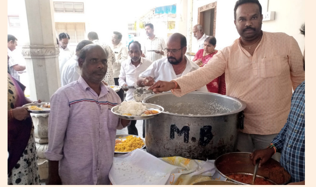
జయభేరి, కామారెడ్డి జిల్లా బ్యూరో, మార్చి 26 :