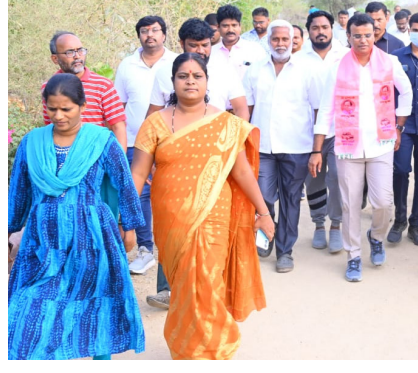
జయభేరి, గాజులరాజువారి :