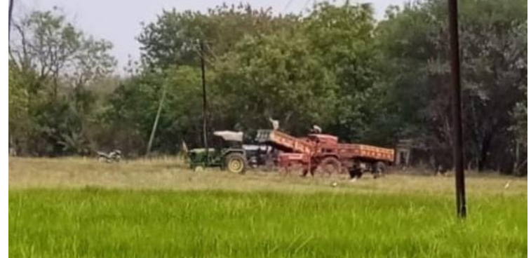
ఇసుక రవాణాకు తెరలేపారు కొందరు అక్రమారులు. జగ్గంగూడ గ్రామం నుంచి పొన్నాలకు

జయభేరి, ఏప్రిల్ 13: అధికారుల కన్ను కప్పి కొందరు యథేచ్ఛగా అక్రమ ఇసుక వ్యాపారం చేస్తూ పర్యావరణానికి హాని కలిగిస్తున్నారు. మేడ్చల్ జిల్లా మాడు చింతల పల్లి మండలం జగ్గంగూడ గ్రామం లోని స్థానికంగా గల వాగులో నుండి అక్రమ