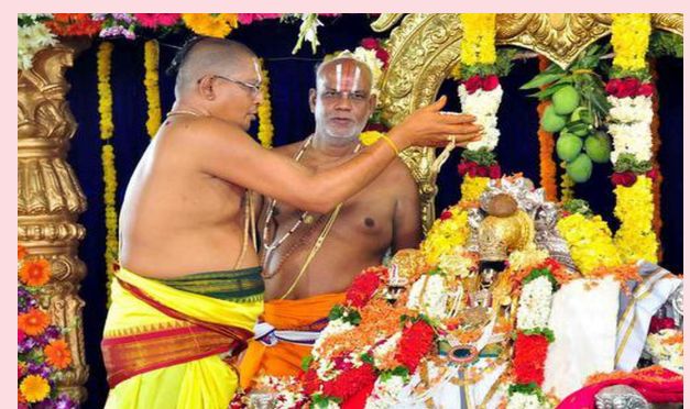
తపాలా, ఆర్టీసీ ద్వారా తలంబ్రాలు... కళ్యాణ మహోత్సవంలో సీతారాములు ఉత్సవ విగ్రహాల మీదుగా పోసిన తలంబ్రాలను భక్తులు ఆసక్తిగా పట్టారు...