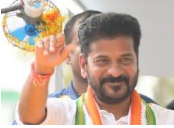
జయభేరి, తిరువనంతపురం, ఏప్రిల్ 18:

లోక్ సభ ఎన్నికల సమరం తారస్థాయికి చేరింది. ప్రధాన పార్టీలన్నీ ప్రచారంలో దూసుకెళ్తున్నాయి. మూడోసారి అధికారం కోసం బీజేపీ, ఎలాగైనా పట్టు సాధించాలని కాంగ్రెస్ పార్టీ నేతృత్వంలోని ఇండియా కూటమి సర్వశక్తులూ ఒడ్డుతున్నాయి. ఈ తరుణంలో తెలంగాణ ముఖ్యమంత్రి రేవంత్ రెడ్డి ఆసక్తికర వ్యాఖ్యలు చేశారు. కేరళలో కాంగ్రెస్ అభ్యర్థుల తరపున ప్రచారం చేస్తున్న రేవంత్ రెడ్డి ఓ జాతీయ ఛానెల్ తో మాట్లాడుతూ.. దక్షిణాదిలో బీజేపీ ప్రభావం ఉండడంపై పేర్కొన్నారు. ఈ ప్రాంతంలోని 130 లోక్ సభ స్థానాల్లో 15 కంటే తక్కువ స్థానాల్లో బీజేపీ విజయం సాధిస్తుందని తెలంగాణ ముఖ్యమంత్రి రేవంత్ రెడ్డి జోషి చెప్పారు. 2024 సార్వత్రిక ఎన్నికలకు ముందు కేరళ.. తమిళనాడు, తెలంగాణ, ఏపీలో ఇలా అన్ని ప్రాంతాలపై ప్రత్యేక దృష్టి సారించి బీజేపీ.. దక్షిణాది రాష్ట్రాలలో తన ఉనికిని విస్తరించేందుకు సర్వశక్తులు ఒడ్డింది. ప్రధానమంత్రి నరేంద్ర మోడీ స్వయంగా రంగంలోకి దిగి.. గత కొన్ని వారాల నుంచి ఆ రాష్ట్రాలలో పరుగు పడటంపై చేశారు. ఈ క్రమంలో రేవంత్ రెడ్డి మాట్లాడుతూ.. సాత్ ఇండియాలోని 130 సీట్లలో ఇండియా కూటమి 115 - 120 మద్దతులను చేసుకుంటుందని తాను ఆశిస్తున్నట్లు చెప్పారు. బీజేపీ ఓడించే ప్రయత్నంలో ఇది కీలకంగా మారుతుందని తెలిపారు.