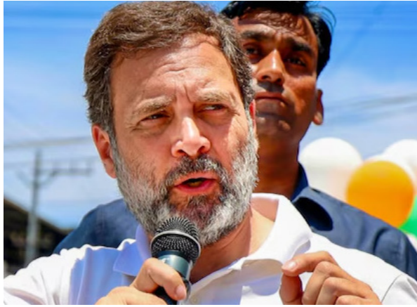
జయభేరి, న్యూఢిల్లీ, ఏప్రిల్ 18:

2024 లోక్ సభ ఎన్నికల తేదీ ప్రకటించగానే ఈసారి ఏ పార్టీ అధికారంలోకి వస్తుంది? ఎవరు ఓడిపోతారు అనే ఊహగానాలు మొదలయ్యాయి. ఇంతలో డెయిలీ హాల్ లో ఒక సర్వే నిర్వహించింది. ఓ ప్రజల అన్ని రాజకీయ పార్టీలూ, అభ్యర్థులూ తామే గెలుస్తామని ధీమా వ్యక్తం చేస్తుంటే, మరోచెప్పే ఏ పార్టీ అధికారంలోకి రావాలి, తాము ఎన్నికైన అభ్యర్థి ఎవరు అన్న దానిపై జనం కూడా లెక్కలేసుకుంటున్నారని ప్రజల నాడిని తెలుసుకునేందుకు ప్రయత్నించింది. ఇందుకోసం 11 భాషా ప్రాతిపదికన దాదాపు 77 లక్షల మందిని ఇంటర్వ్యూ చేశారు. వీరందరినీ వివిధ రకాల ప్రశ్నలు అడిగారు. దాని ఆధారంగా ఒక నివేదికను రూపొందించారు. రాష్ట్రాల వారీగా ...మిగతాది 2 లో