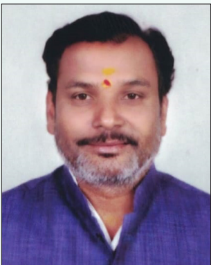
మల్వాజ్జురి సత్యం మాడే