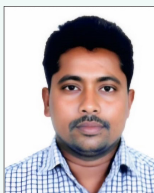
ఖమ్మం కుక్కల నాగయ్య గౌడ్