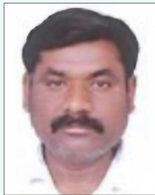
నిజామాబాద్ యగేందర్ గడ్డ