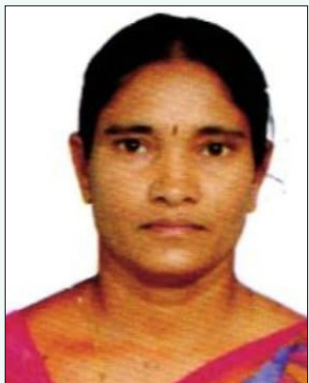
జహీరాబాద్ చవగాని మణి