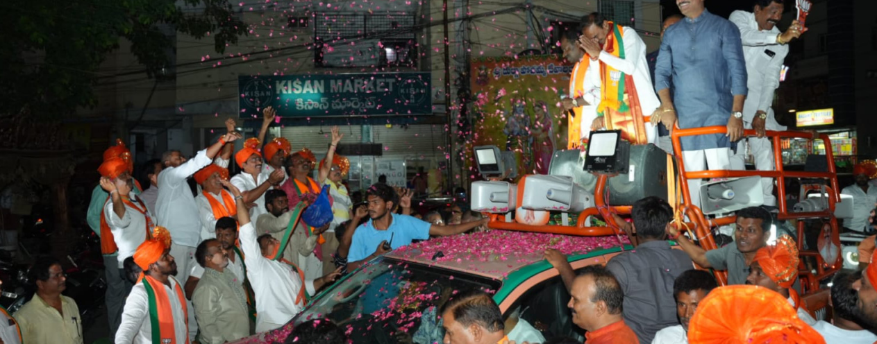
అన్నాడు. నేను లేచి సూటిగా అడిగాను, అన్నిటో నెంబర్ వన్ అంటున్నారే... తెలంగాణలో తాగుడు కూడా నెంబర్ వన్ అన్న విషయం మర్చిపోయావా కేసీఆర్. రేపు కేంద్రంలో ప్రధాన మంత్రి అయ్యేది