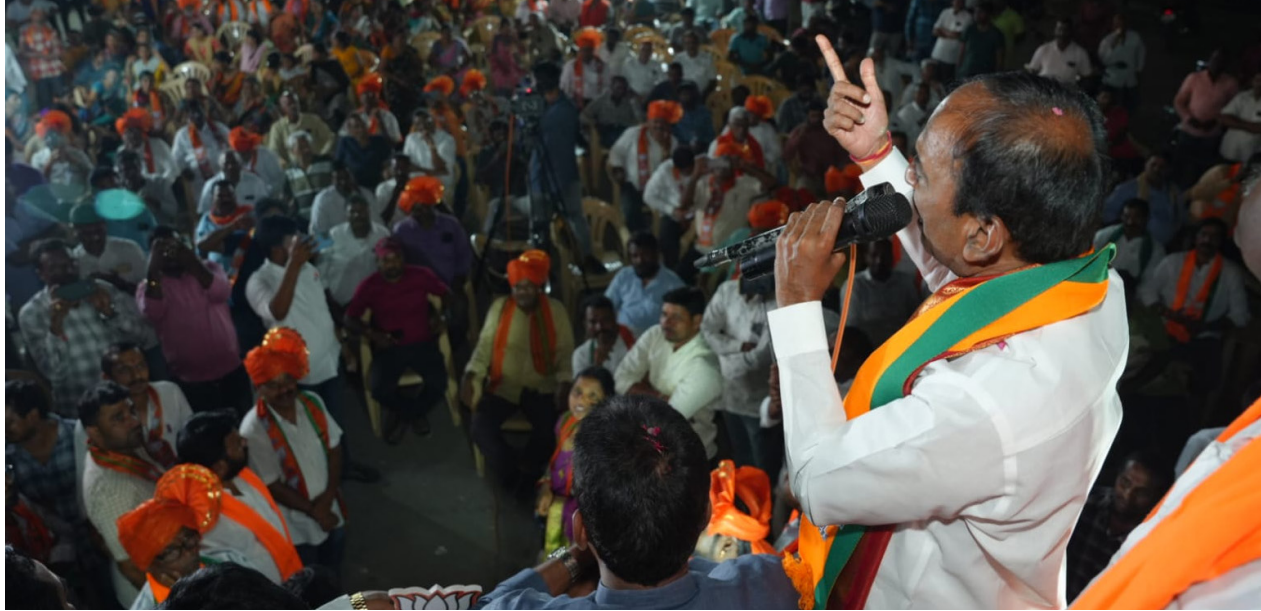
అన్నాడు. నేను లేచి సూటిగా అడిగాను, అన్నిటో నెంబర్ వన్ అంటున్నారే... తెలంగాణలో తాగుడు కూడా నెంబర్ వన్ అన్న విషయం మర్చిపోయావా కేసీఆర్. రేపు కేంద్రంలో ప్రధాన మంత్రి అయ్యేది