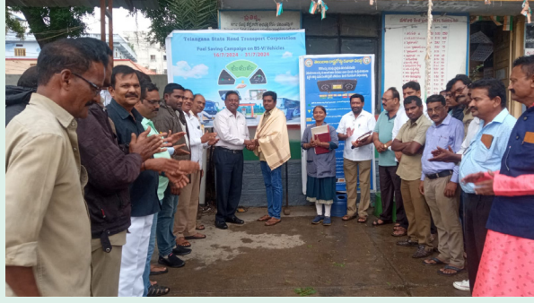
సిబ్బంది ఆత్మవిమర్శ చేసుకుంటూ కలిసికట్టుగా పనిచేయాలి