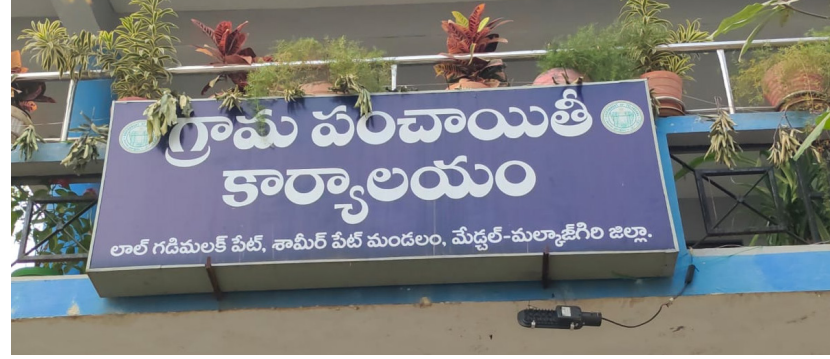
లాల్ గడి మాలక్ పేట్, శామీర్ పేట్ మండలం, మేడ్చల్-మల్కాజ్గిరి జిల్లా.

లేని అనుమతులను స్వచ్ఛందం అధికారులు, పాలకవర్గం... అనుమతులు లేని లే బెట్ చేసి పాత జీపీ అనుమతులు ఉన్నాయంటూ పాత టెడీలో సంతకాలు పెట్టి స్వచ్ఛందం. గత 20 ఏండ్ల క్రిందనే చేసినట్లు అనుమతులు పొందినట్లు ప్రచారం చేసి ప్లాట్ విక్రయాలు