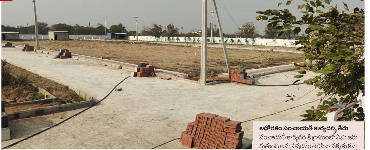
అధికారం పంచాయతీ కార్యదర్శి తీరు

చేపట్టారు అక్రమాలు... విస్తారం ఏమింటే లేని సర్పంచల సంతకాలు ఎలా వచ్చాయి అనేది ఒక్క అంతు చిక్కిన ప్రశ్న...? దీనికి పూర్తి మద్దతుగా అధికారులు అండగా ఉండి పూర్తి సహకారం అందించి అందిన కాడికి దండుకున్నారనే ఆరోపణలు బహిరంగంగానే వినిపిస్తున్నాయి. విధి నిర్వహణ మరిచి ఎక్కడ అక్రమ నిర్మాణాలు, అక్రమ లే బెట్ లు అవుతున్నాయో అక్కడ ప్రత్యక్ష మై కాసుల వేట సాగిస్తున్నారు. ఎవరైనా అడిగితే దీపం ఉన్నప్పుడే ఇల్లు చక్కదిద్దుకోవాలి కదా అని బహిరంగంగానే బదులు చెప్పన్నారు. అధికారుల విషయమే ఇలా ఉంటే ఇక పాలకుల పై ఎలా ఉండో అర్థం చేసుకోవచ్చు. పాలకులు అధికారులతో కలిసి గ్రామాభివృద్ధికి తోడ్పడాలి కానీ ఇక్కడ మాత్రం కాసుల కోసం ఒక్కటై దబ్బులు దండుకుంటూ గ్రామ అభివృద్ధి పథకాలను ప్రజలకు చేరవేసి విధంగా భార్యలు నిర్వహించాల్సిన అధికారులు తమ