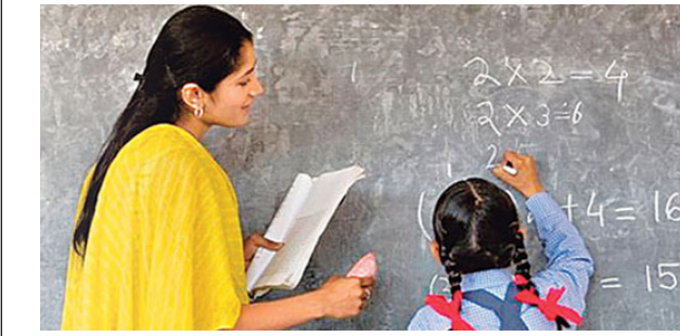
జయభేరి, హైదరాబాద్, ఆగస్టు 15:

త్వరలోనే తెలంగాణ డీఎస్సీ ఫలితాలు విడుదలయ్యే అవకాశం ఉంది. అలసాం కాకుండా పరీక్షలు పూర్తి అయిన కొద్దోజుల్లోనే హాథమిక కీతో పాటు రెస్పాన్స్ షీట్లను విద్యార్థులు అందుబాటులోకి తీసుకొచ్చింది. ఆగస్టు 20వ తేదీతో అభ్యం తరాల స్వీకరణ ప్రక్రియ కూడా పూర్తి కానుంది. ఈ నెలపూర్తి త్వరితగతిన ఫలితాలను కూడా ప్రకటించే యోచనలో విద్యార్థులు ఉంది. తెలంగాణలో అధికారంలోకి వచ్చిన కాంగ్రెస్... మోగా డీఎస్సీ నోటిఫికేషన్ ఇచ్చింది. ఆ వెంటనే షెడ్యూల్ ప్రకటించటంతో పాటు పరీక్షలను కూడా పూర్తి చేసింది. సాధ్యమై నంత త్వరగా కొత్త టీచర్ల సేవలను