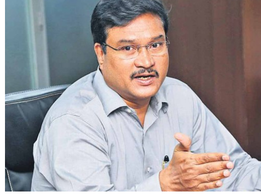
జయభేరి, హైదరాబాద్, సెప్టెంబర్ 4:

హైదరాకు ఫిర్యాదు చేస్తామంటూ బెదిరించి వసూళ్లకు పాల్పడితే జైలు శిక్ష అంటూ తప్పకుండా హైదరా కమిషనర్ ఏపీ రంగనాథ్ హెచ్చరించారు. కొద్ది రోజులుగా ట్రై సిటీ పరిధిలో హైదరా విభాగం అక్రమ నిర్మాణాల తొలగింపులు చేపడుతున్న నేపథ్యంలో కొద్దిమంది సామాజిక కార్యకర్తల ముసుగులో అక్రమాలకు పాల్పడుతున్నారు. బఫర్ జోన్, ఎస్.టి.ఎల్ పరిధిలో లేదా వాటి పరిధిలో నిర్మాణం చేపడుతున్న బిల్డర్లను ఇది అక్రమ నిర్మాణమని, బఫర్ జోన్, ఎస్.టి.ఎల్ పరిధిలో నిర్మిస్తున్నారని హైదరాకు ఫిర్యాదు చేస్తామని బెదిరిస్తున్నారు. అలాగే అధికారులతో ఉన్న పోటీలు చూపిం హైదరా విభాగంలోని ఉన్నతాధికారులతో తమకు పరిచయం ఉన్నాయని, మీకు పాంటి సమస్య రాకుండా చేస్తామని ఇంకొకసారి కొంత డబ్బు ముట్టజేపాలని ఒత్తిడి చేస్తున్నారని చెప్పారు. హైదరాకు ఫిర్యాదు చేస్తామని కొంతమంది వ్యక్తులు, సంస్థలు, బిల్డర్లను, బహుళ అంతస్తులు, వ్యక్తిగత గృహాల్లో నివాసం ఉంటున్న వారి పద్ద ఇంకొకటి బెదిరింపులకు పాల్పడుతున్నట్లు తమ దృష్టికి వచ్చిందన్నారు. ఎవరైనా బెదిరింపులకు పాల్పడినా ఇతర ప్రభుత్వ విభాగాలైన రెస్ట్రా, మున్సిపల్, నీటి పారుదల విభాగాల్లో ఇలా ఒత్తిడి చేస్తే ప్రజలు, బిల్డర్ల తక్షణమే స్టానిక పోలీస్ స్టేషన్లో గాని ఎస్పీ, సీఐటి గాని లేదా హైదరా కమిషనర్, ఏసీఐకి ఫిర్యాదు చేయాలన్నారు. ఈ విభాగాన్ని సీని గార్యాలని చూసినా, తప్పుదోప పట్టించే విధంగా ప్రయత్నించినా అలాంటి వారిపై కఠిన చర్యలు తీసుకుంటామని హెచ్చరించారు.