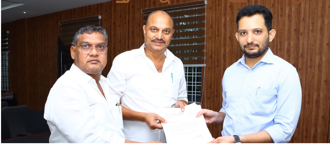
ఈ కమ్యూనిటీ హాల్ సంబంధించి గతంలోనే 80లక్షల రూపాయలు నిధులు మంజూరు చేయించినా, అధికారంలోకి తీసుకొని నిర్మాణాలు పూర్తి చేసినట్లయితే స్థానిక డివిజన్ లోని ప్రజలకు ఎంతో ఉపయోగకరంగా ఉంటుందిని వారు తెలిపారు.