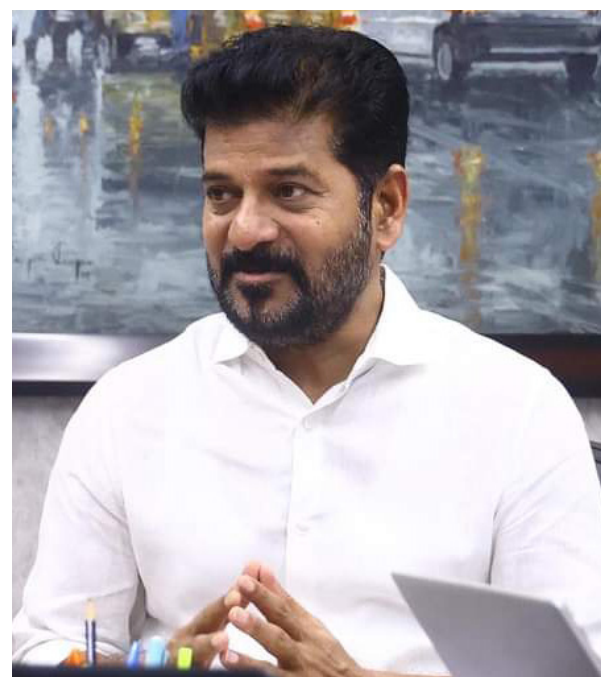
జయభేరి, హైదరాబాద్, సెప్టెంబర్ 4:

ఎడతెరిసి లేని వర్షాలు, వరదల తాకిడికి రెండు తెలుగు రాష్ట్రాల ప్రజలు బెంబేలెత్తిపోతున్నారు. తెలంగాణ, ఆంధ్రప్రదేశ్ లో ఎవర్నీ కదిలించినా కన్నీటి చిత్రాలే. ముఖ్యంగా తెలంగాణలోని ఖమ్మం జిల్లా, ఆంధ్రప్రదేశ్ లోని కృష్ణా జిల్లాల ప్రజలు వర్షాలు, వరదలతో తీవ్ర ఇబ్బందులు పడుతున్నారు. పరిస్థితులు రోజురోజుకీ ఘోరంగా మారిపోతున్నాయి. దీనిపై వివక్షలనుంచి రెండు రాష్ట్రాల్లోని అధికార పార్టీలు తీవ్ర విమర్శలు ఎదుర్కొంటున్నాయి. పక్క రాష్ట్రం కన్నా బాగా చేశాం: రేవంత్ రెడ్డి ...మిగతాది 2లో