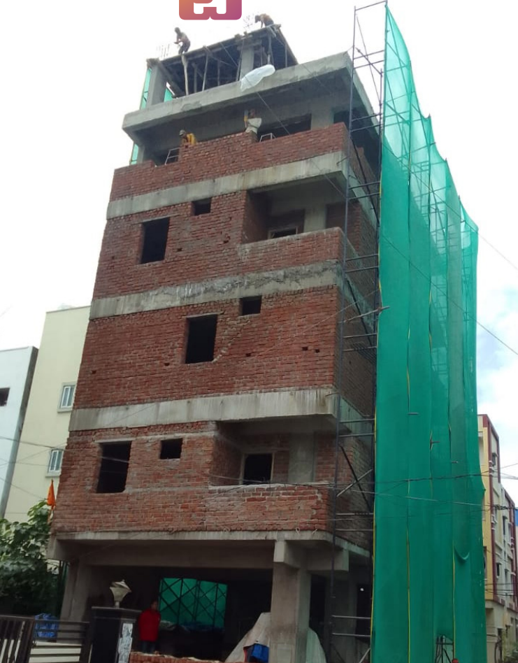
ర్యాన్సు భవనాన్ని తనిఖీలు చేసి తగిన చర్యలు తీసుకోవాలని అలాగే అక్రమ నిర్మాణాల విషయంలో నిర్ణయం తీసుకున్న ముషీరబాద్ టౌన్ ప్లానింగ్ అధికారులను విచారించి శాఖపరమైన చర్యలు తీసుకోవాలని విన్నవించుకుంటున్నాం.

సికింద్రాబాద్ జోన్ ముషీరబాద్ సర్కిల్ పరిధిలోగల శివం రోడ్డులోని పక్కంటి ఇంటి నెం: 221109/BK/LIG లో నిర్మించిన అక్రమ నిర్మాణం శరవేగంగా కొనసాగుతున్న అధికారులు నిమగ్న నిరీక్షణలు వ్యవహరిస్తున్నారు. సికింద్రాబాద్ జోన్ ముషీరబాద్ సర్కిల్ పరిధిలో ఒక నిర్మాణం శరవేగంగా కొనసాగుతుంది. అయితే ఆ నిర్మాణం పర్యవేక్షణ ఉంటే నిర్మాణం మరలా ఉంటుంది. జి.హెచ్.ఎం.సి నిబంధనలను ఉల్లంఘించి ఒక కట్టడంగా నిర్మించడం గాక ఇప్పటికే అనుమతిమించి స్టీల్ 5 గా భవనాన్ని నిర్మించడం జరుగుతుంది.