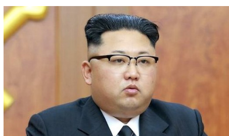
జయభేరి, న్యూఢిల్లీ, సెప్టెంబర్ 4:

30 మంది అధికారులను ఉరి తీత ఉత్తర కొరియా ప్రభుత్వం సంచలన నిర్ణయం