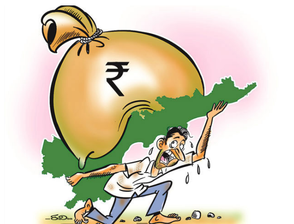
జయభేరి, విజయవాడ, నవంబర్ 2:

రాష్ట్ర ప్రభుత్వం నిధులను సమకూర్చే ప్రక్రియలో భాగంగా.. అప్పు కోసం ఆస్తులను ఇండెంట్ పెడుతుంది. ప్రభుత్వానికి చెందిన సెక్యూరిటీ బాండ్లను కూటమి ప్రభుత్వం వేలానికి పెట్టింది. ఇప్పటివరకు ఆరుసార్లు రూ. 20,000 కోట్ల అప్పు కోసం సెక్యూరిటీ బాండ్లను వేలానికి పెట్టింది. తాజాగా ఈనెల 29న నిర్వహించిన సెక్యూరిటీ వేలంలో మరో రూ. 3,000 కోట్ల అప్పు కోసం ఇండెంట్ పెట్టింది. రిజర్వ్ బ్యాంక్ ఆఫ్ ఇండియా కోర్ట్ బ్యాంకింగ్ సొల్యూషన్ (ఈకుబేర్) వేలం వేసింది. కాంటిటీటివ్, నాన్ కాంటిటీటివ్ బిడ్స్ రూపంలో ఆర్ బిబి వాటిని విక్రయించింది. ...మిగతాది 2లో