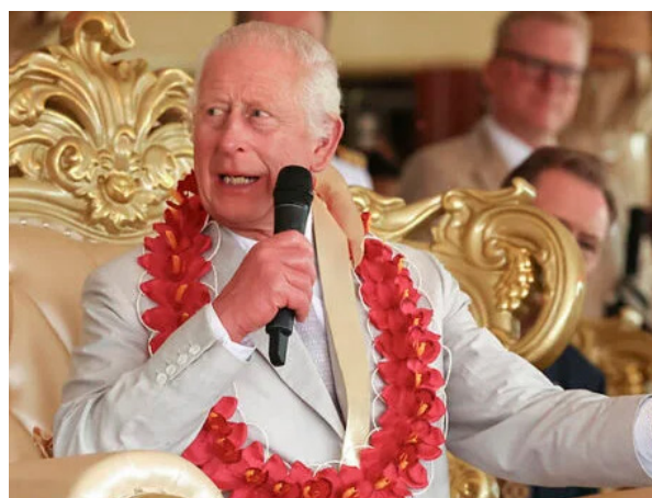
జయభేరి, న్యూఢిల్లీ, నవంబర్ 2:

బ్రిటన్.. భారత్ ను 200 ఏళ్లు పరిపాలించిన దేశం. మన సంపదను కొల్లగొట్టిన సామ్రాజ్యవాద రాజ్యం. ప్రపంచంలో ఎంతో అభివృద్ధి చెందిన దేశం. కానీ, రాజు వైద్యం కోసం మళ్ళీ భారత్ కు వచ్చారు. బ్రిటిష్ పాలనలో భారతీయులు సుమారు 200 ఏళ్లు కట్టు బానిసత్వం బతికారు. మనల్ని పాలిస్తూ.. మన సంపదను తరలించుకుపోయారు. వ్యాపారాన్ని విస్తరించారు. 1947, ఆగస్టు 15న స్వాతంత్ర్యం ఇచ్చారు. మనకన్నా ఎంతో అభివృద్ధి చెందిన దేశం బ్రిటన్. ఆ దేశ అభివృద్ధిలో భారతీయుల శ్రమ, కష్టం ఉన్నాయి. ఇంత అభివృద్ధి చెందిన దేశం.. నేటికీ కొన్ని విషయాల్లో ...మిగతాది 2లో