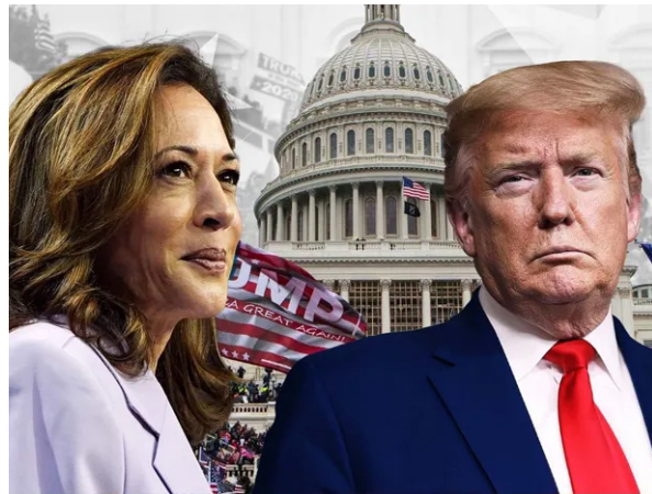
జయభేరి, న్యూఢిల్లీ, నవంబర్ 2:

అమెరికా అధ్యక్ష ఎన్నికలకు మరో 3 రోజులే గడువు ఉంది. నవంబర్ లోకి ఎంటర్ అయ్యాం. డింట్ అగ్రరాజ్యం ఓటర్లు ఎన్నికల మూడ్ లోకి వెళ్లారు. ఎవరికి ఓటేయాలో డిస్టెంట్ అవుతున్నారు. తమ అధినేత ఎవరు కావాలో నిర్ణయం తీసుకుంటున్నారు. అమెరికా ఓటర్లు తమ అధినేతను నిర్ణయం తీసుకునే పనిలో నిమగ్నం అయ్యారు. నవంబర్ 5న నిర్వహించే పోలింగ్ లో తమ తీర్పును వెల్లడించేందుకు సిద్ధమవుతున్నారు. ఇక ప్రపంచ దేశాలు కూడా అగ్రరాజ్యాధినేత ఎవవుతారు.. తమకు ఎవరు అయితే లాభం.. ఎవరు అయితే నష్టం అని లెక్కలు వేసుకుంటున్నాయి. యావత్ ...మిగతాది 2లో