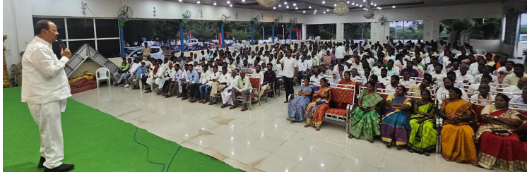
న్నామన్నారు. రైతుల సంక్షేమానికి కాంగ్రెస్ ప్రభుత్వం పెట్టడం వేస్తుందన్నారు. ఇప్పటి వరకు మొత్తం నియోజకవర్గంలో 101 కోట్ల 79 లక్షల 20 వేల 432 రూపాయలు నిధులు రాష్ట్ర ప్రభుత్వం నుండి కొన్ని మంజుర్ కొన్ని ప్రతిపాదనలో ఉన్నాయి. మరో 100 కోట్లకు పైగా నిధులతో నియోజకవర్గంలో ఇంటిగ్రిటెడ్ రెసిడెన్షియల్ స్కూల్ ఏర్పాటుకు మంజూరి తీసుకొని రావడం జరిగిందన్నారు. నిరుద్యోగ యువత యువకులకు ఉద్యోగ ఉపాధి అవకాశం ములు కల్పించుకు వారికి స్థిర దివలమెంట్ ప్రోగ్రామ్ ఇప్పించి జాబ్ మేకాప్ అతి త్వరలో చేపట్టబడుతున్నాయి. కాకతీయ మెగా డెవలప్ మెంట్ పార్కు ముఖ్యమంత్రి గౌరవ శ్రీ రేవంత్ రెడ్డి ని ఆహ్వానించి భూములు కోల్పోయిన రైతులకు 100 గజాల స్థలం ఇవ్వాలని కోరడం జరిగిందన్నారు. త్వరలోనే వారికి ఇంటి స్థలాలు ఇప్పించి తూములు, ఇందిరమ్మ ఇల్లు కూడా త్వరలోనే ఇప్పిస్తామన్నారు.