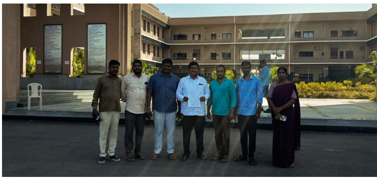
లకు మెరుగైన విద్య అందించడానికి తప్పనిసరిగా విద్యా వాలంటీర్లు అవసరం ఉందని వారు హితోన్నాచారు. ఒకేసారి వారిని వద్దని ఆడిషాలు జారీ చేయడంతో వారి పరిస్థితి అగమ్యగోచరంగా మారిందన్నారు. వారి పరిస్థితులు, విద్యా ధర్మ భవిష్యత్ ను దృష్టిలో ఉంచుకుని వారిని కొనసాగించాలని విజ్ఞప్తి చేశారు. అయితే ఈ