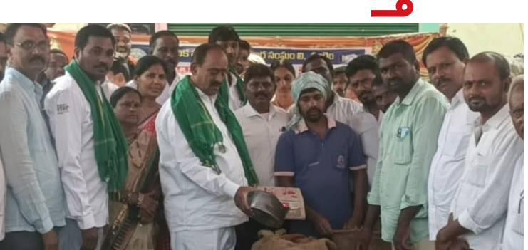
ర్షయించిన ప్రకారం 17% మాయురట్ ఉండాలి అని అన్నారు. కేవలం ప్రభుత్వ కొనుగోలు కేంద్రాలలో మాత్రమే సస్పెన్షన్ బోనస్ లభిస్తుందన్నారు. రైస్ మిల్లలో విక్రయాలకు బోనస్ వర్తించడం ప్రతి ఒక్క రైతుకు ఈ విషయంపై అవగాహన కల్పించాలని సూచించారు. ధాన్యం కొనుగోలు కేంద్రాల్లో మౌలికసదుపాయాలు కల్పించాలని అధికారులను ఆదేశించారు. రవాణా, హామాలిలు, గోన సంచుల కొరత రాకుండా చూడాలని అన్నారు.

పరకాల నియోజకవర్గంలోని సంగం ప్రాథమిక పుస్తకాల సహకార సంఘం ఆధ్వర్యంలో ఏర్పాటుచేసిన పరి ధాన్యం కొనుగోలు కేంద్రాన్ని శుభవారం పరకాల శాసనసభ్యులు రేవారి ప్రకాష్ రెడ్డి ప్రారంభించారు. ఈ సందర్భంగా ఎమ్మెల్యే మాట్లాడుతూ రైతులు పండించిన ధాన్యాన్ని కొనుగోలు కేంద్రాల్లోనే విక్రయించాలి. రైతులు పండించిన ప్రతి ధాన్యం గింజను ప్రభుత్వమే కొనుగోలు చేస్తుందన్నారు. ఏగ్రేడుకు రూ. 2320, కామన్ రకానికి రూ. 2300 ధర చెల్లిస్తుందని, రైతులు దళాలను అక్షయించి మోసపోవడం నివారించారు. సన్న క్రకం ధాన్యానికి రూ. 500 బోనస్ అందిస్తున్నట్లు ప్రభుత్వం ని