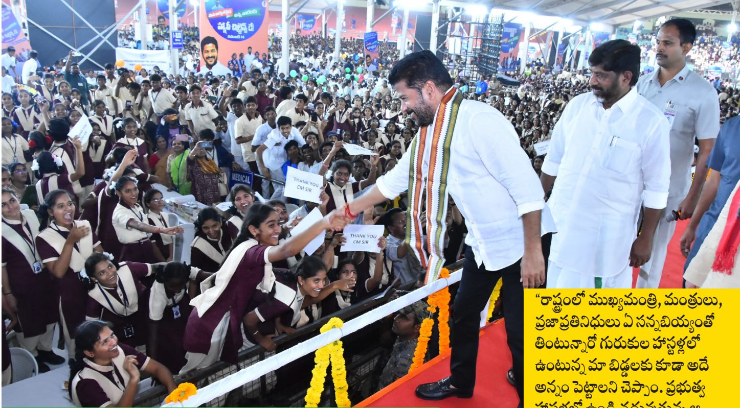
రేపటి పౌరుల మోములో ఈ ఆనందం..

ముఖ్యమంత్రి రేవంత్ రెడ్డి 20వ తేదిన వేములవాడ పర్యటన ఏర్పాట్లపై అధికారులకు మంత్రి పోస్టుంట్ ప్రభాకర్ దిశా నిర్దేశం చేశారు. శృంగేరి పీఠాధిపతి సూచనల మేరకు దేవాలయ అభివృద్ధి పై పలు కార్యక్రమాలకు ముఖ్యమంత్రి శంఖు స్థాపన చేయనున్నారు. ముఖ్యమంత్రి వేములవాడ కార్యక్రమంలో మంత్రులు, ఎమ్మెల్యేలు పాల్గొంటున్న నేపథ్యంలో భద్రతా చర్యలపై పోలీసులతో చర్చించాలని జిల్లా కలెక్టర్ కి ఆదేశించారు. సమావేశంలో దేవాలయ మ్యాస్టర్ ఫ్రాన్స్, అభివృద్ధి వేదపాఠశాల అలయ భూసేకరణ పై చర్చించారు. వేములవాడ నిత్యాన్నదాన సత్రం 10 వేల మంది చేసేలా ప్రణాళిక, నిత్యాన్నదాన సత్రం భవనం మంజూరు చేస్తామన్నారు.