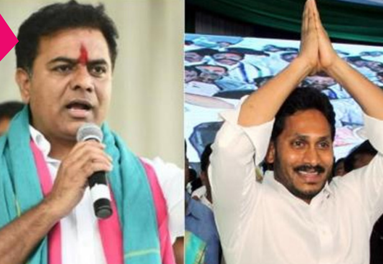
జయభేరి, హైదరాబాద్, నవంబర్ 17:

జైలుకు వెళ్లడం, పాదయాత్రలు చేయడం.. రాజకీయ నాయకులకు ఫ్యాషన్ గా మారింది. జైలుకు వెళ్లినా.. పాదయాత్ర చేసిన గెలిచి సీఎం అవుతామని భావిస్తున్నారు. గతంలో అయ్యారు కూడా. అందుకే ఇప్పుడు తెలుగు రాష్ట్రాలకు చెందిన ఇద్దరు కీలక నేతలు జైలుకు వెళ్లడానికి తహతహలాడుతున్నారు. ఉమ్మడి ఆంధ్రప్రదేశ్ లో.. విభజిత తెలుగు రాష్ట్రాల్లో అధికారంలోకి రావడానికి నేతలు మొన్నటి వరకు పాదయాత్రలు చేశారు. ప్రజల్లోకి వెళ్లడం నేతలకు కలిసి వస్తోంది. అసెంబ్లీ ఎన్నికల్లో పార్టీలను గెలిపిస్తోంది. నేతలను సీఎంలను చేస్తోంది.