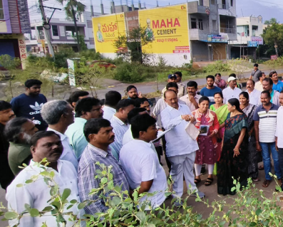
అధికారులు, ప్రజాప్రతినిధులు బాధ్యతగా పనిచేసి ప్రజల నుండి వచ్చిన విజ్ఞప్తులను వెంటనే పరిష్కరించేలా దృష్టి సాధించాలన్నారు. నాన్ లేబల్ ప్లాట్ లలో ఇల్లు కట్టరాదని, లే అవుట్ లేకుండా ప్లాట్లు కొనరాదు, అమ్మ రాదు అని, ప్లాట్లు చేసిన వారికి

నోటీసులు ఇవ్వాలని సైడ్ డ్రైవ్లో ఉన్న ఎలక్ట్రికల్ పోల్స్ లను పక్కకు మార్చాలని తెలిపారు. బంధం రోడ్డులోని పైపైలైన్ కల్పనను క్లియర్ చేయాలని, మూసిన వారికి నోటీసులు అందజేసి వారిపై తగు చర్యలు చేపట్టాలన్నారు. బంధం రోడ్డులో జెసిబి పెట్టి ట్రాక్టర్లతో చెత్తను తీసివేయాలన్నారు. పిఎల్ నుండి బంధం రోడ్డు పరకు బిల్డి రోడ్డు పనులకు డిపిఆర్ తయారు చేయాలని, దామరచెరువు వుత్తడి, కల్లర్లు కి రిడిజైన్ చేయాలన్నారు. మానూషి విగ్రహం వద్ద విద్యుత్ ఏర్పాటుకు ప్రతిపాదనను పంపాలని, వాక్యో కి అనుగుణంగా పాత్ వె ఏర్పాటుకు ప్రోజెక్ట్ పంపించాలన్నారు. పట్టణంలోని అన్ని వార్డులలో వర్షపు నీరు నిలవకుండా, బంధం ముందు కాకుండా పనులు చేపట్టాలని, హోట్లర్, ఇంటి పరిసర ప్రాంతాలను పరిశుభ్రంగా ఉంచుకోవాలి అని అన్నారు. ఇందిరమ్మ ఇండ్ల మంజూరి విషయంలో దర్యాప్టులు స్వీకరించి గ్రామసభలు ఏర్పాటుచేసి గ్రామాలలో ఉన్న వారికి ప్రయోజనాల ప్రకారం ఇండ్ల మంజూరు చేస్తామన్నారు. రాజశీలాలకు అతితగ్గా సీఎంఆర్ఎఫ్ కళ్యాణ లక్ష్మి షాద్ ముబారక్ చెక్కులను పంపిణీ చేస్తామని తెలిపారు.