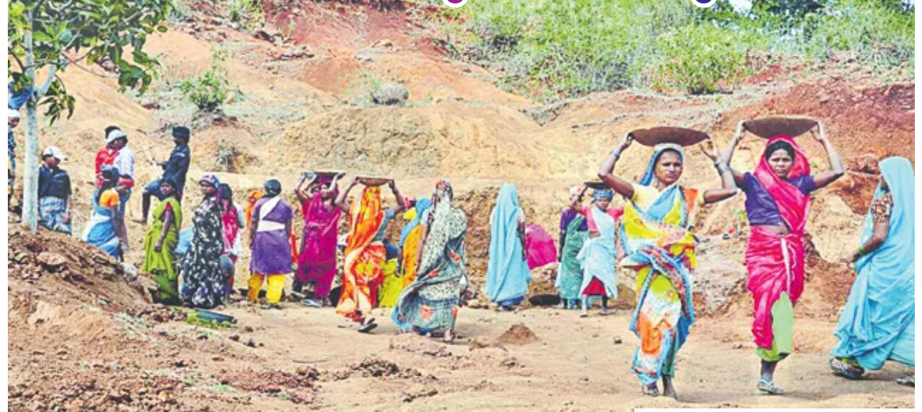
ఉపాధి పనులకు లభించే కూలీ, కూలీల కుటుంబ పోషణకు సరిపోక అనేక ఇబ్బందులకు గురవుతున్నారు. 2020, -21లో రూ. లక్షా 9 వేల కోట్లు కేటాయిస్తూ, 2022, 2023లో రూ. 73 వేల కోట్లకు నిధుల కేటాయింపు తగ్గింది. 2024, -25 బడ్జెట్లో 60 వేల కోట్లు మాత్రమే కేటాయించారు. 2021లో వేతన కూలీ 255 రూపాయలు ఉంటే, నేడు 305 రూపాయలుగా ఉంది. పెరిగిన వేతనం ప్రకారం ప్రకారం తాజా బడ్జెట్లో రూ. లక్షా 30 వేల కోట్లు కేటాయింపులు తగ్గింపై న్యాయ స్థానం స్పందిస్తూ తీరుబడిగా వేతనాలు ఇస్తామంటే ఎలా కుదురుతుంది? కరువుసాయం చేయడమంటే ఏదో ముట్టి వేస్తున్నామన్న భావన, ఉండటం మంచి పద్ధతి కాదు" అని వ్యాఖ్యానించింది మహాత్మా గాంధీ గ్రామీణ ఉపాధి హామీ పథకం అవినీతికి నిలయంగా మారింది.

మహాత్మా గాంధీ గ్రామీణ ఉపాధి హామీ పథకం ప్రారంభమై 18 సంవత్సరాలు పూర్తి అయినా, గ్రామీణ పేదలకు పథకంలో పేర్కొన్న విధంగా పనులు కల్పించడంలో విఫలమైంది. గ్రామీణ పేదలకు సంవత్సరానికి 100 రోజులు పని కల్పించాల్సిన ఈ పథకం దినదిన గండం మారింది. 2005 ఆగస్టు 23న గ్రామీణ ఉపాధి హామీ పథకాన్ని ప్రారంభించింది. ఆమోదించింది.