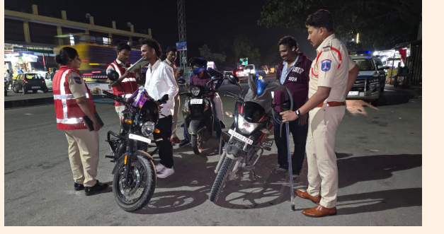
జయభేరి, డిసెంబర్ 30:

శామీర్ పేట పోలీస్ పరిధిలో వివరాలు ఇలా గత ఏడాది 1406 పిటిషన్లు రాగా, ఈ ఏడాది 2014 పిటిషన్లు పరిష్కరించబడ్డాయి. ఇందులో 922 ఎఫైర్ నమోదు చేయగా, రోజువారీ 391 కేసులు రాజీ చేసినట్లు తెలిపారు.