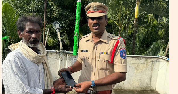
జయభేరి, డిసెంబర్ 30:

మేడ్చల్ మల్కాజిరి జిల్లా తర్కపల్లి ప్రాంతంలో ఏర్పాటు చేసిన జినోమ్ వ్యాల్ పోలీస్ స్టేషన్ లో పలు కేసులపై నిబంధనలకు అనుగుణంగా చిన్న చిన్న దొంగతనాలు చేసిన ముఠాలకు చెక్ పెట్టి దొంగిలించిన వాహనాలను స్వాధీనం చేసుకున్నారు అలాగే సైబర్ క్రైమ్ విషయంలో అల్లర్ గా ఉండి ఎప్పటికప్పుడు ప్రజలకు అందుబాటులో ఉండి న్యాయం చేస్తున్న పోలీసులు. జినోమ్ వ్యాల్ పోలీస్ స్టేషన్ పరిధిలో మహిళపై నేరాలు జరగకుండా ఎప్పటికప్పుడు అవగాహన సదస్సు చిన్న పోలీస్ స్టేషన్ అయినా క్రైమ్ జరగకుండా ఎప్పటికప్పుడు సిబ్బంది అలర్ట్ చేస్తూ నిరూపించిన పనిచేస్తున్న జినోమ్ వ్యాల్ పోలీసులు.