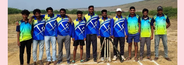
ఓపెన్ క్రికెట్ టోర్నమెంట్ జయభేరి, గజ్జెల, జనవరి 12: