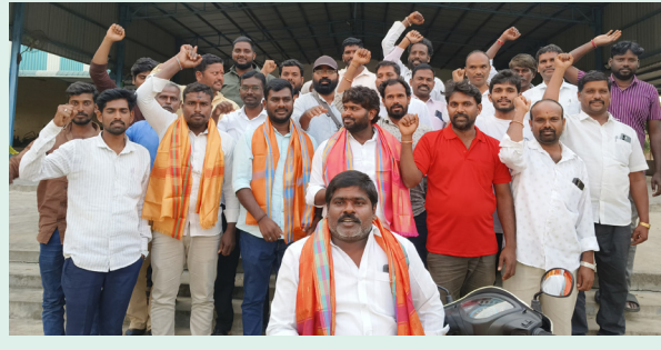
జయభేరి, వర్గల్, జనవరి 15 :